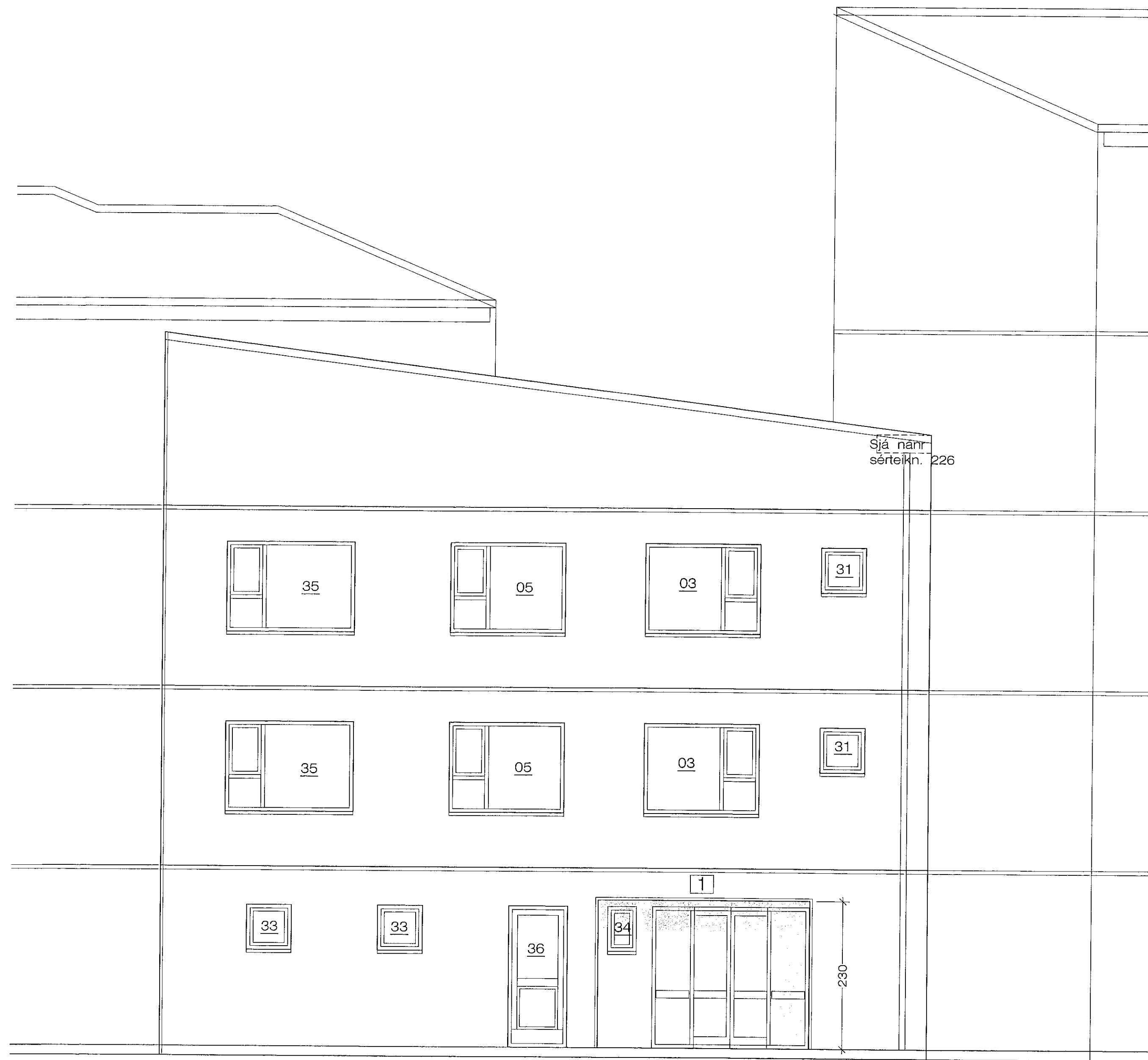
Norðurhlíð. 1 : 50 Beint framan á hliðin.

Samþykkt bann 22 JUL 2020 Byggingarfulltrúinn í Hafnarfirði F.n. Sigurður Steinar Jónsson