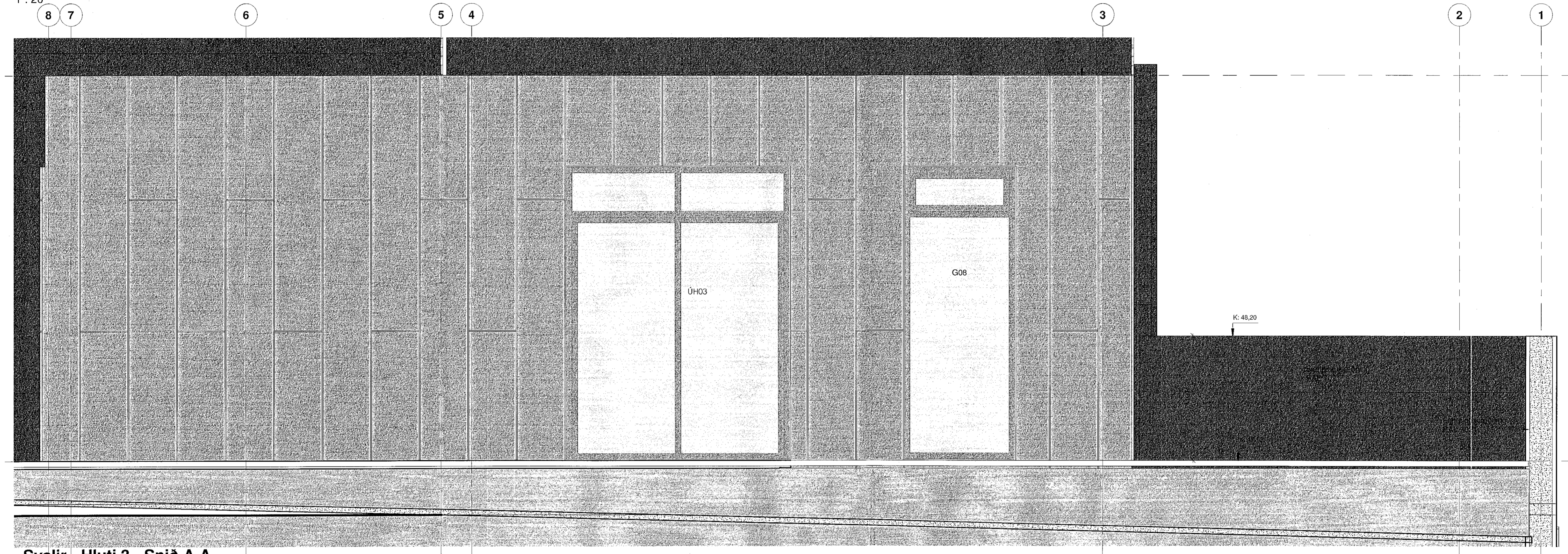
Svalir - Hluti 3 - Snið A-A 1 : 20