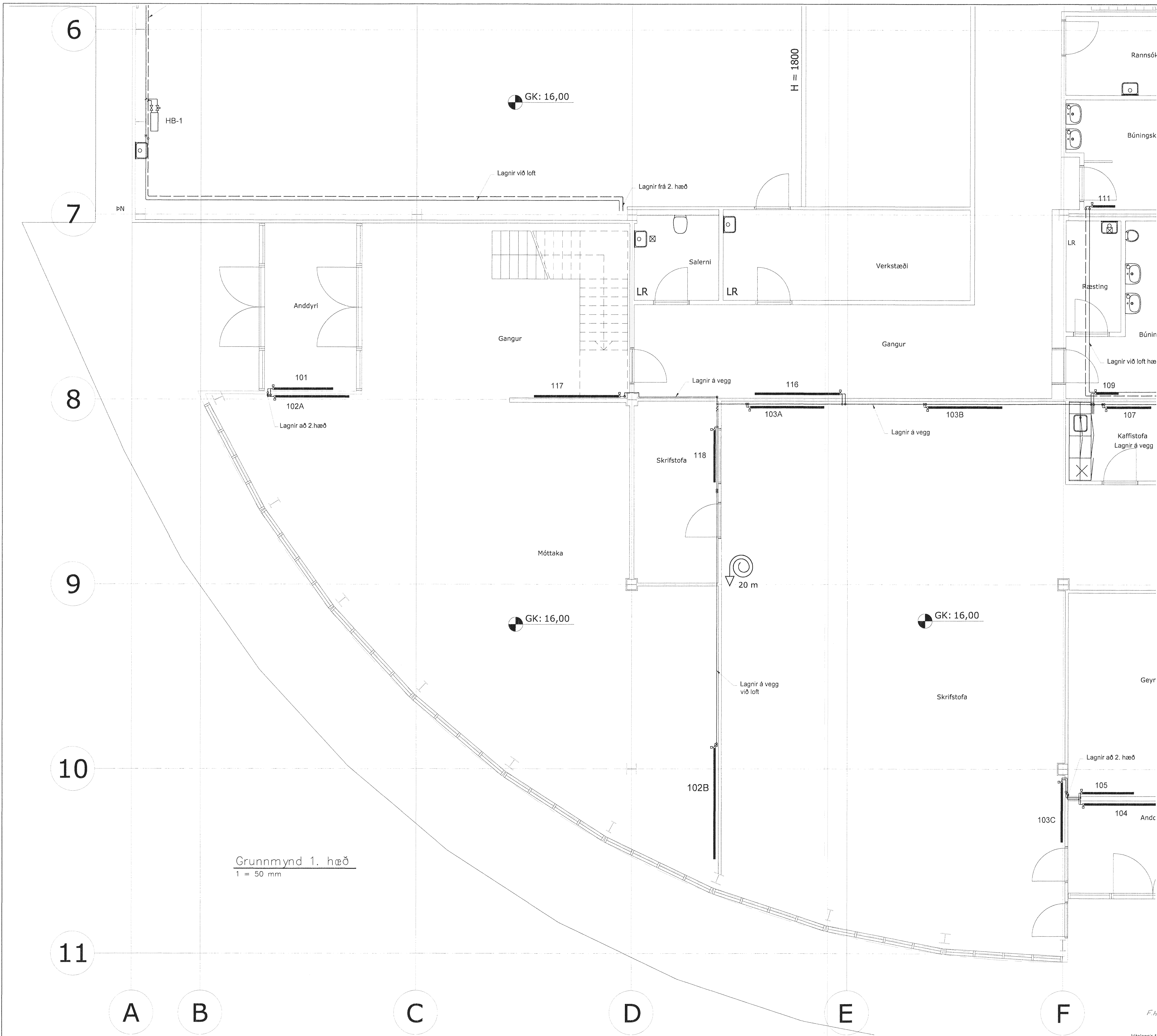
Grunnmynd 1. hæð 1 = 50 mm