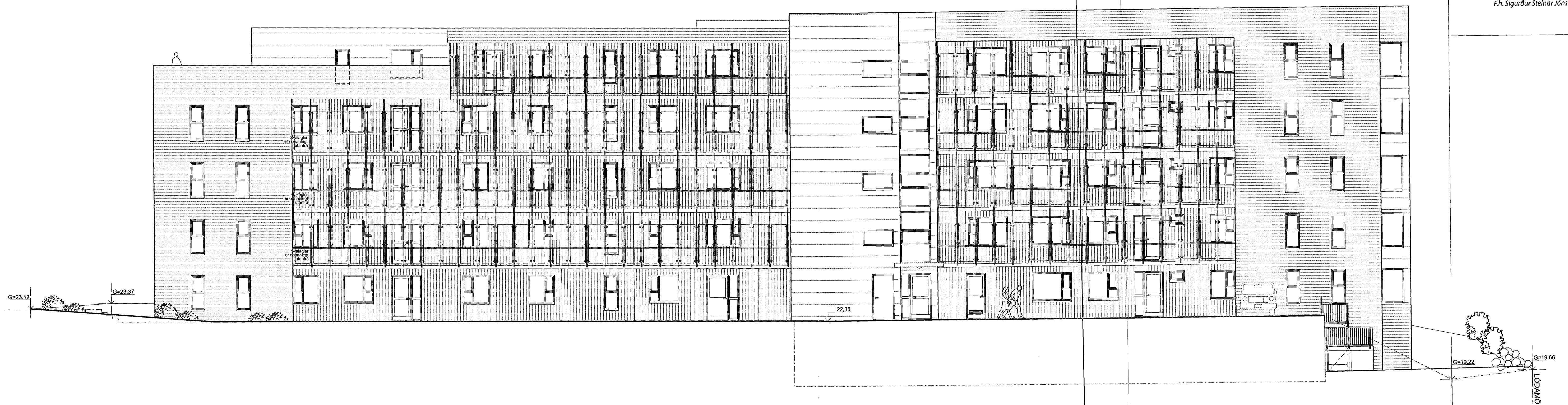
ÚTLIT 1:100 Norð-austurhlíð

Samþykkt þann 19 SEP 2012 Byggingafulltrúinn í Hafnarfirði F.h. Sigurður Steinar Jónsson