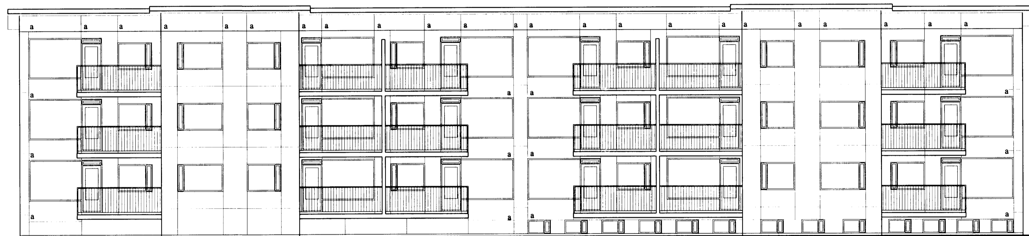
Útlit Suðvestur 1:100