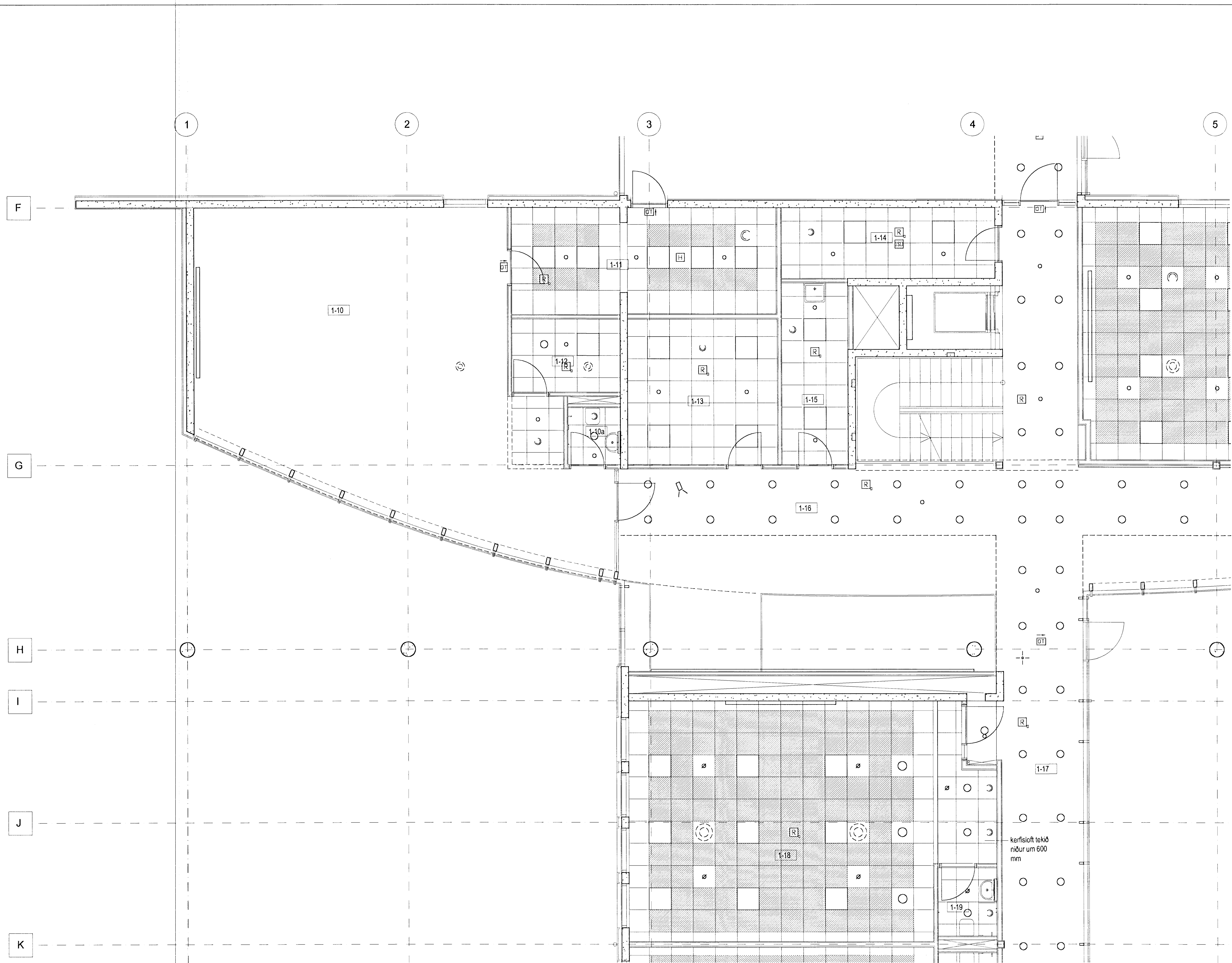
GRUNNMYND 1. HÆÐAR 1:50, AÐALÁLMA

skástíkuð svæði á kerfislöfum merkja gataðar hjóðisgöngur kerfislöf eru almennt tekin niður um 450mm nema annað sé tekið fram