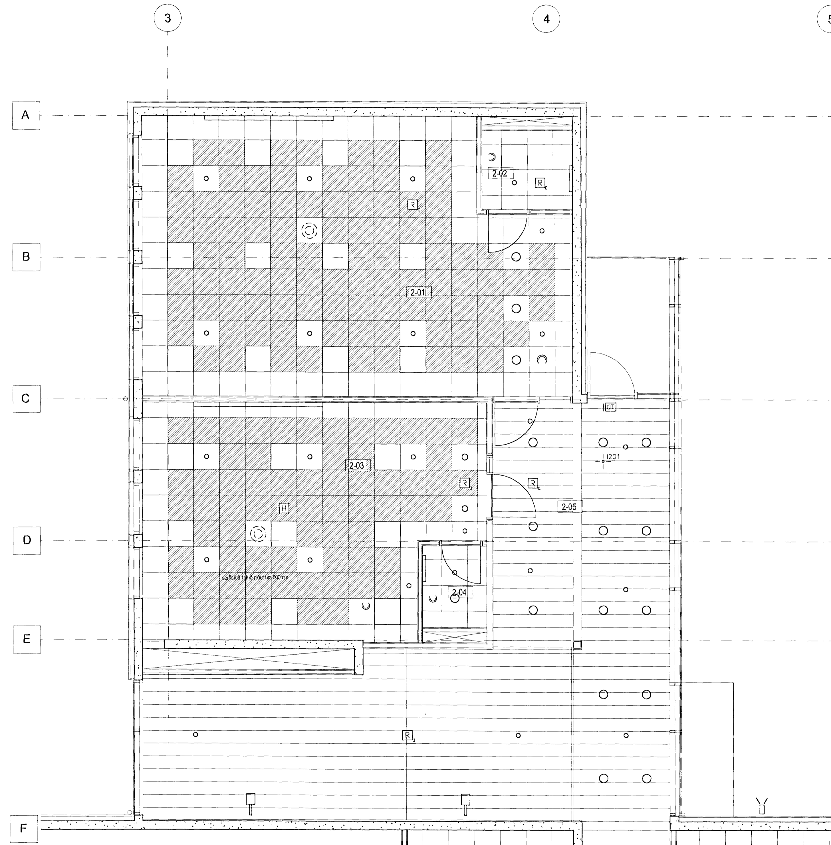
GRUNNMYND 2. HÆÐAR 1:50, ÞVERÁLMA

Skástíkuð svæði á kerfisloftum merkja gataðar hjóðisogspötur Kerfisloft í kennslustofum eru almennt tekin niður um 450 mm nema annað sé tekið fram hæð á kerfislofta: sjá sniðteikningar