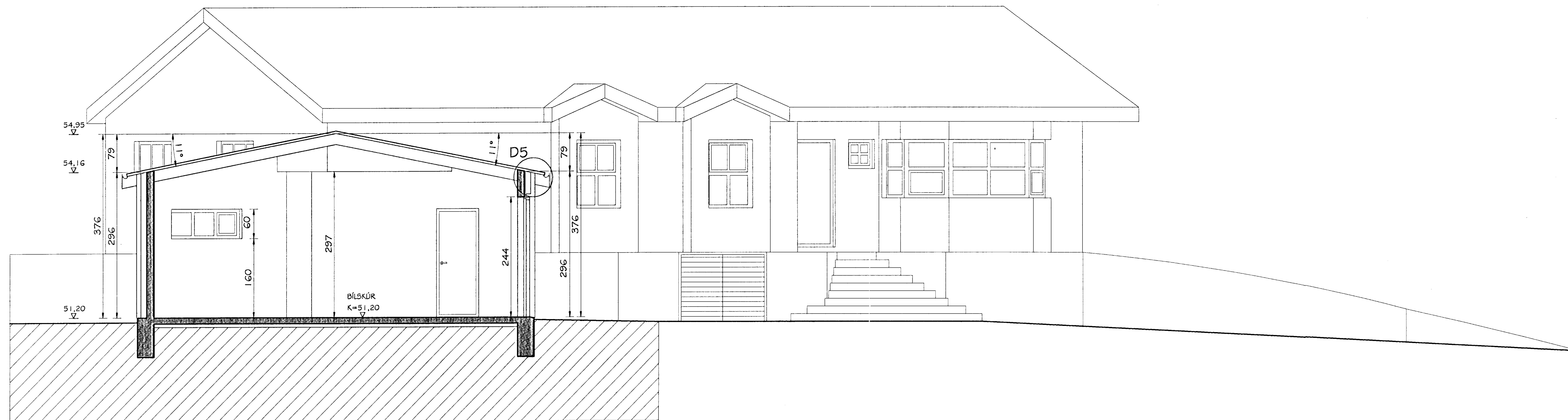
SNID D-D MKV. 1:50