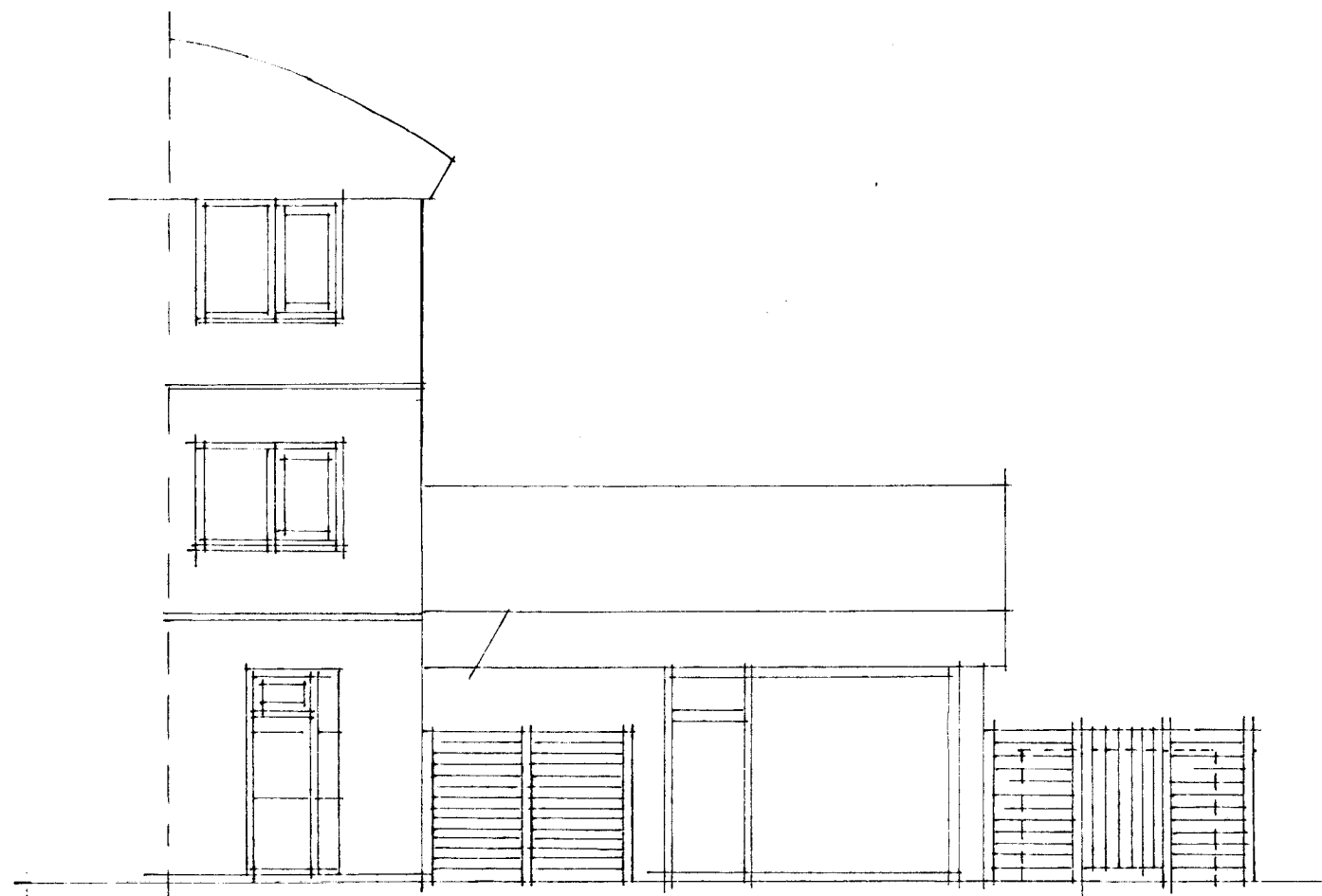
SUDUR MKV. 1:100