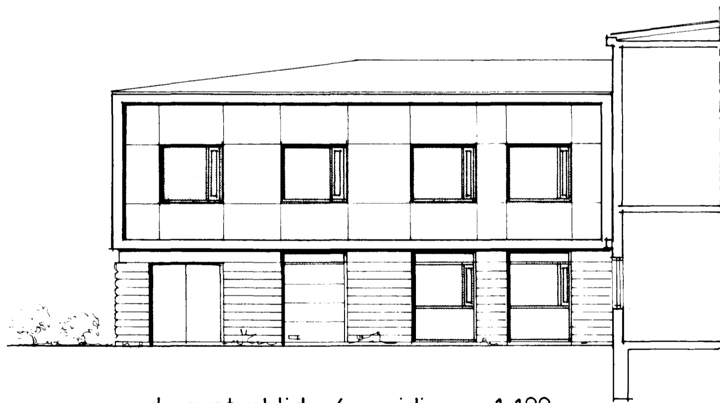
sud austurhlid / sneiding 1:100