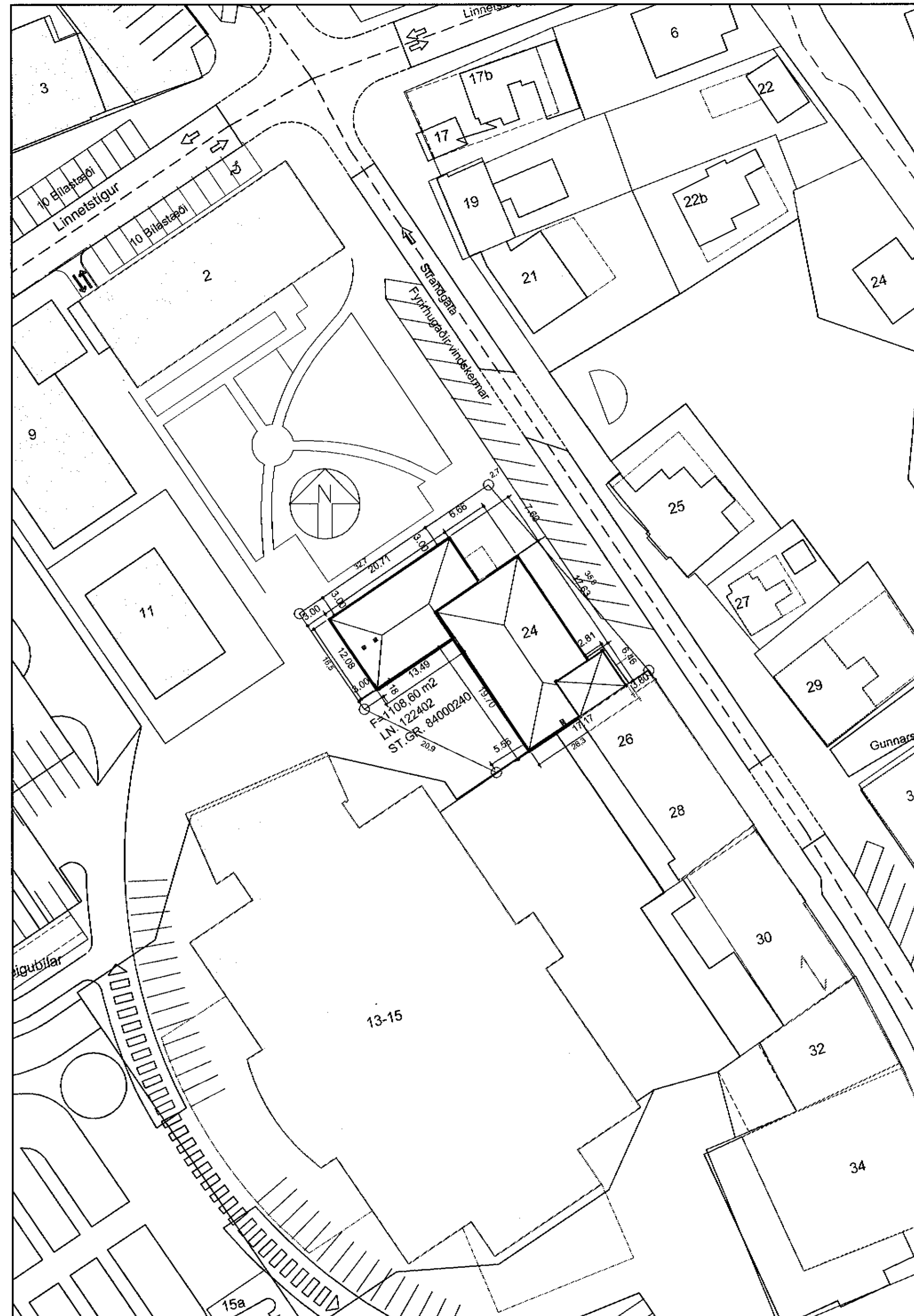
AFSTÖÐUMYND MKV 1:500