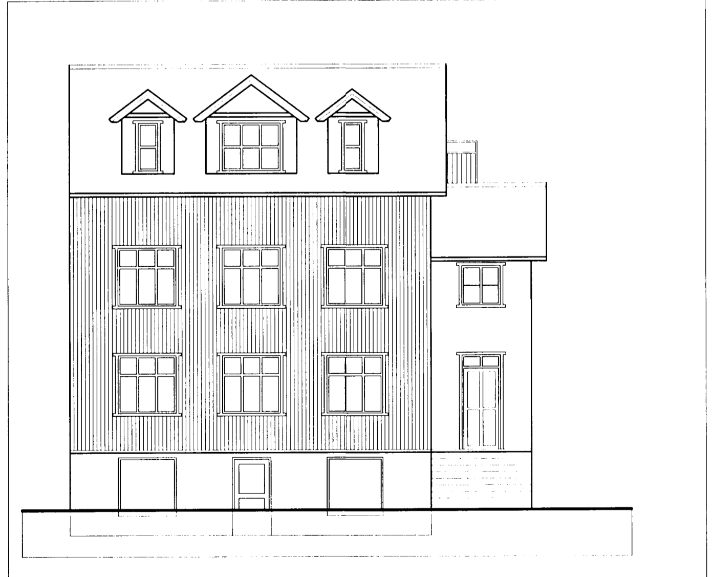
Útlit Suður (að Strandgötu) 1:100