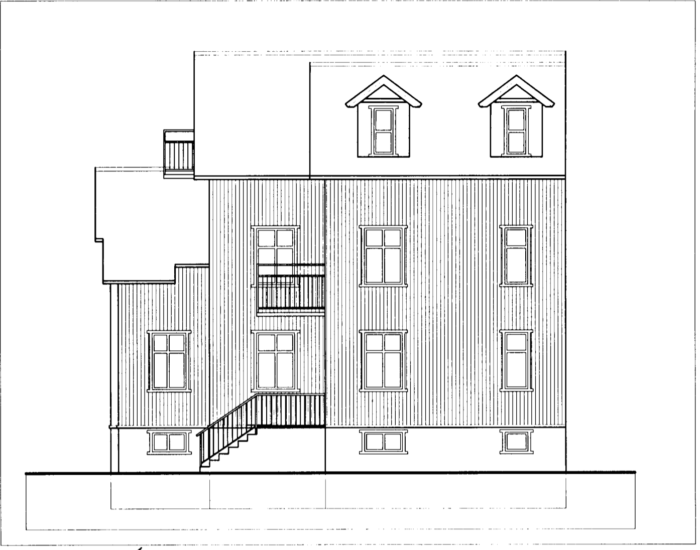
Útlit Norður 1:100