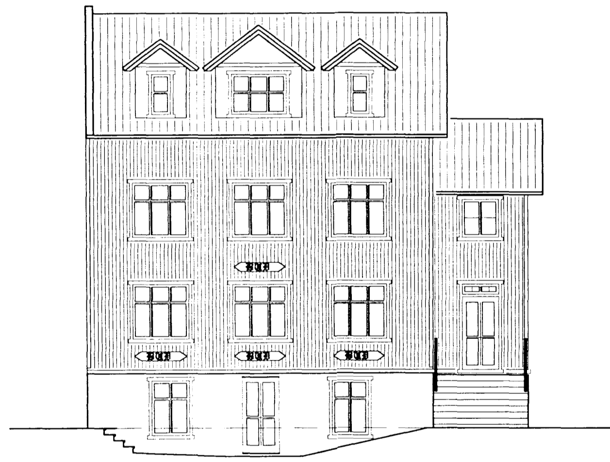
FRAMHLIÐ - SUÐUR