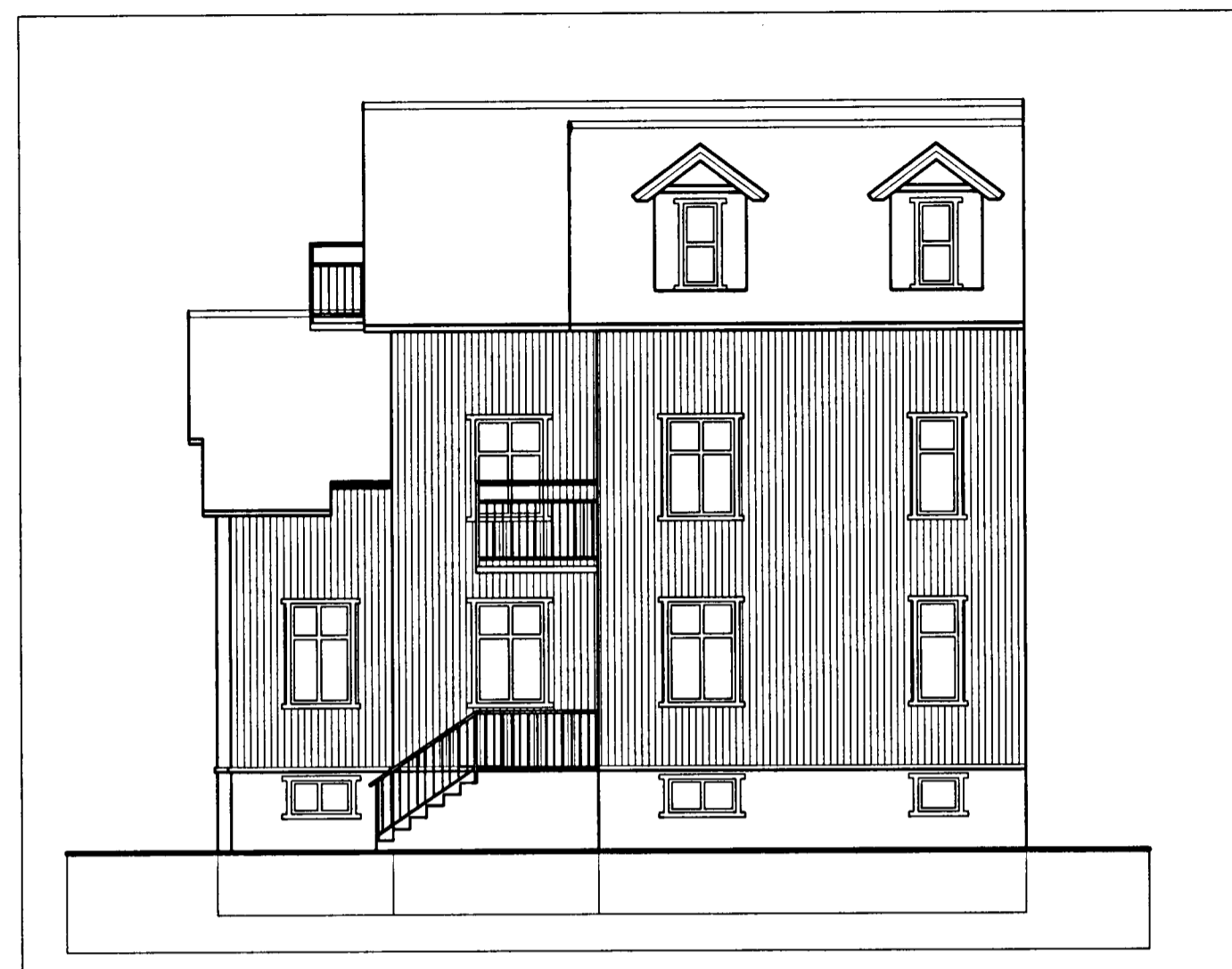
Útlit Norður 1:100