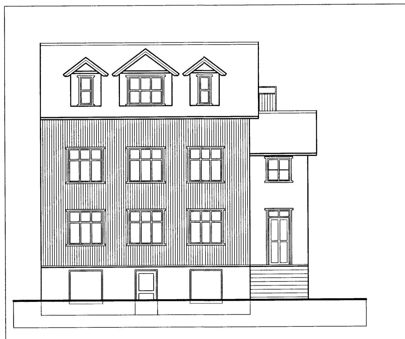
Útlit Suður (að Strandgötu) 1:100