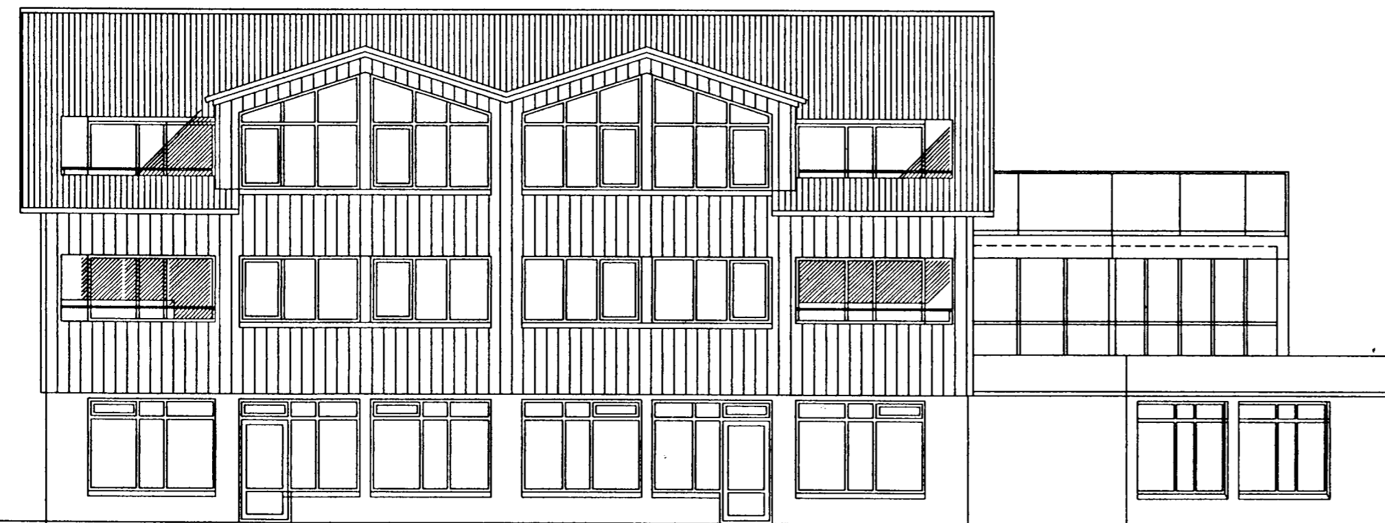
VESTUR, AÐ STRANDGÖTU