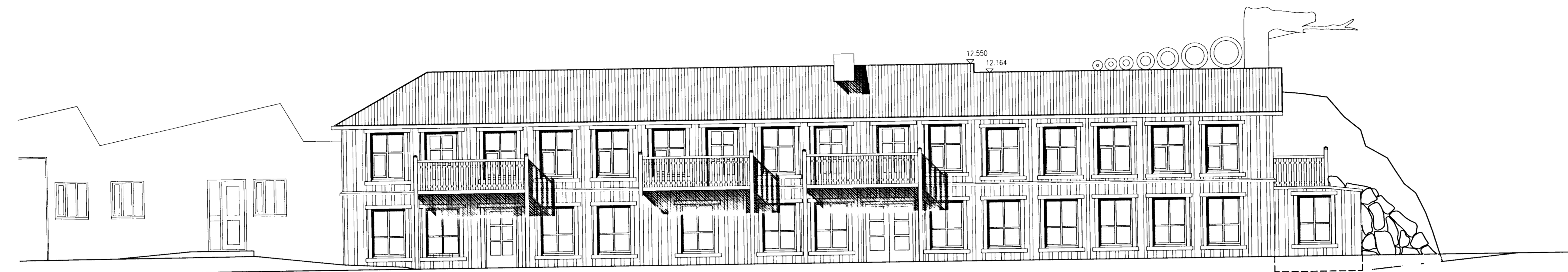
ÚTLIT NORÐUR 1:100