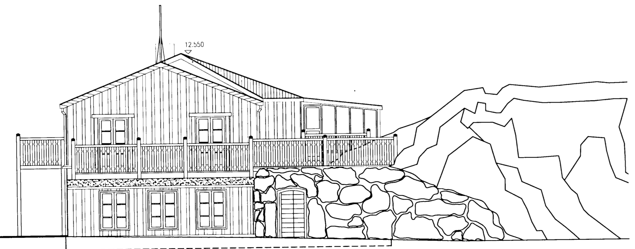
ÚTLIT VESTUR 1:100