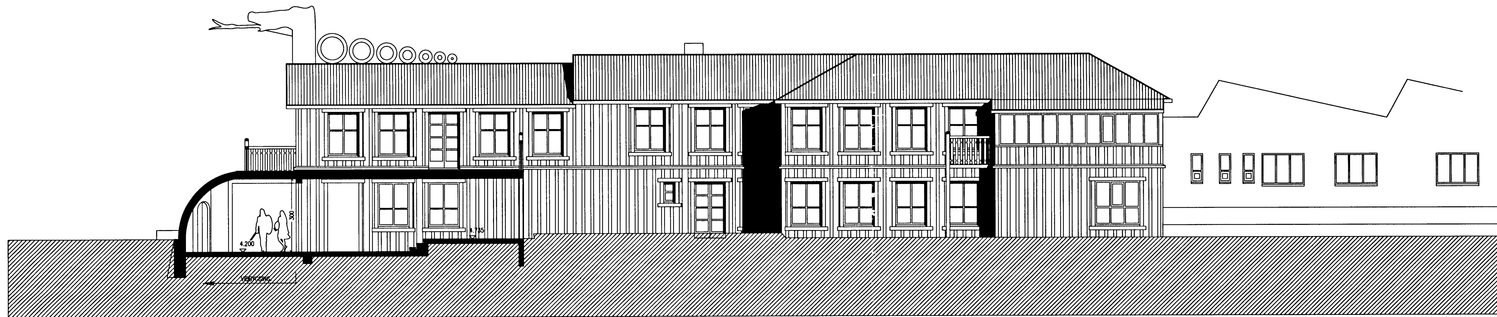
ÚTLIT SUÐUR 1:100