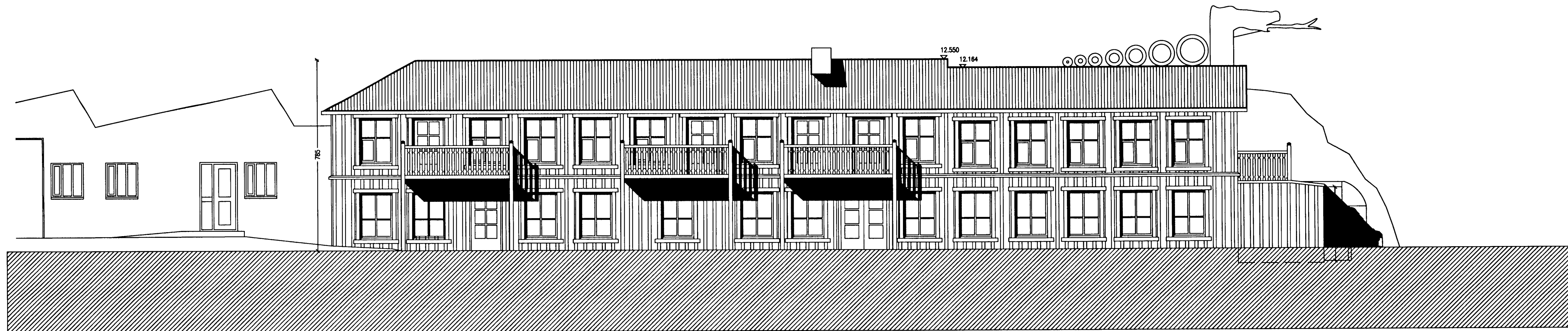
ÚTLIT NORÐUR 1:100