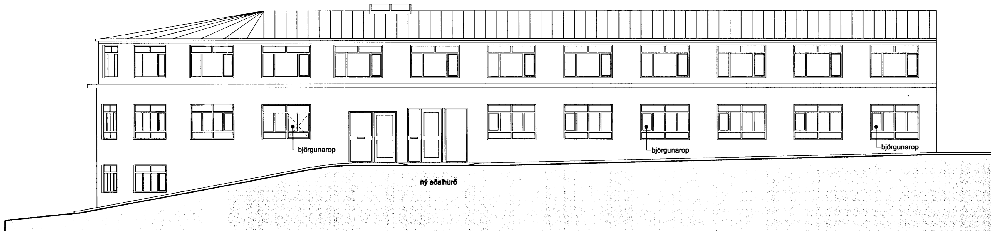
Útlit til suðausturs, 1: 100