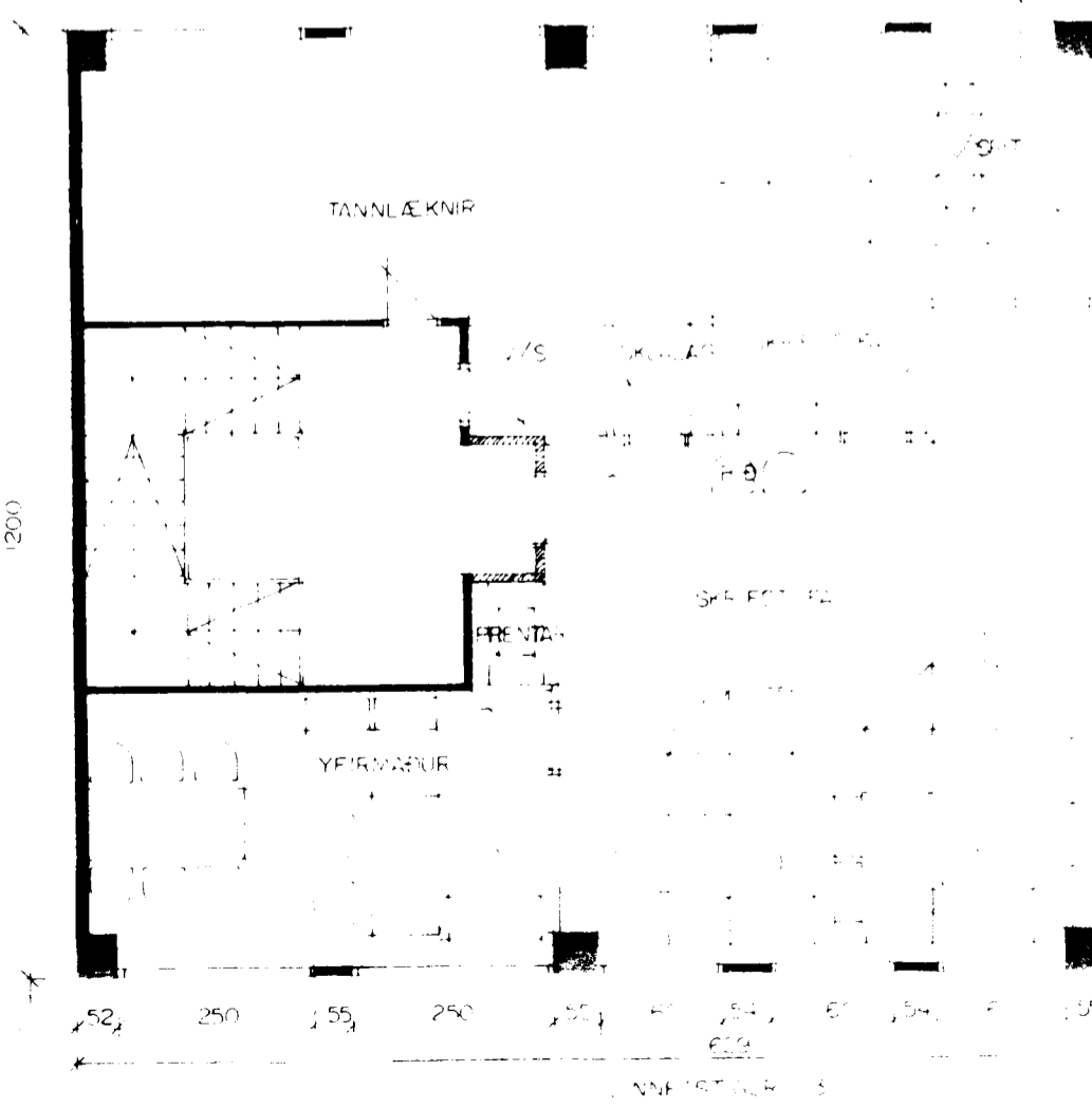
GRUNNMYND 2 HÆÐ MKV. 1:100.