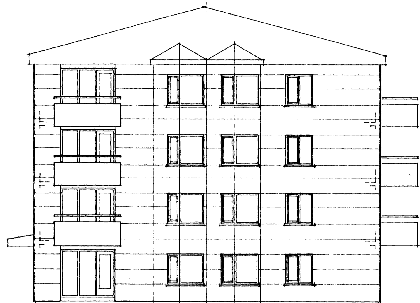
ÚTLIT VESTUR 1:100