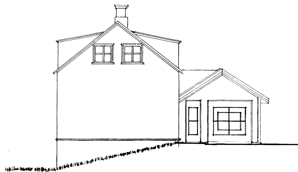
ÚTLIT - SUÐUR