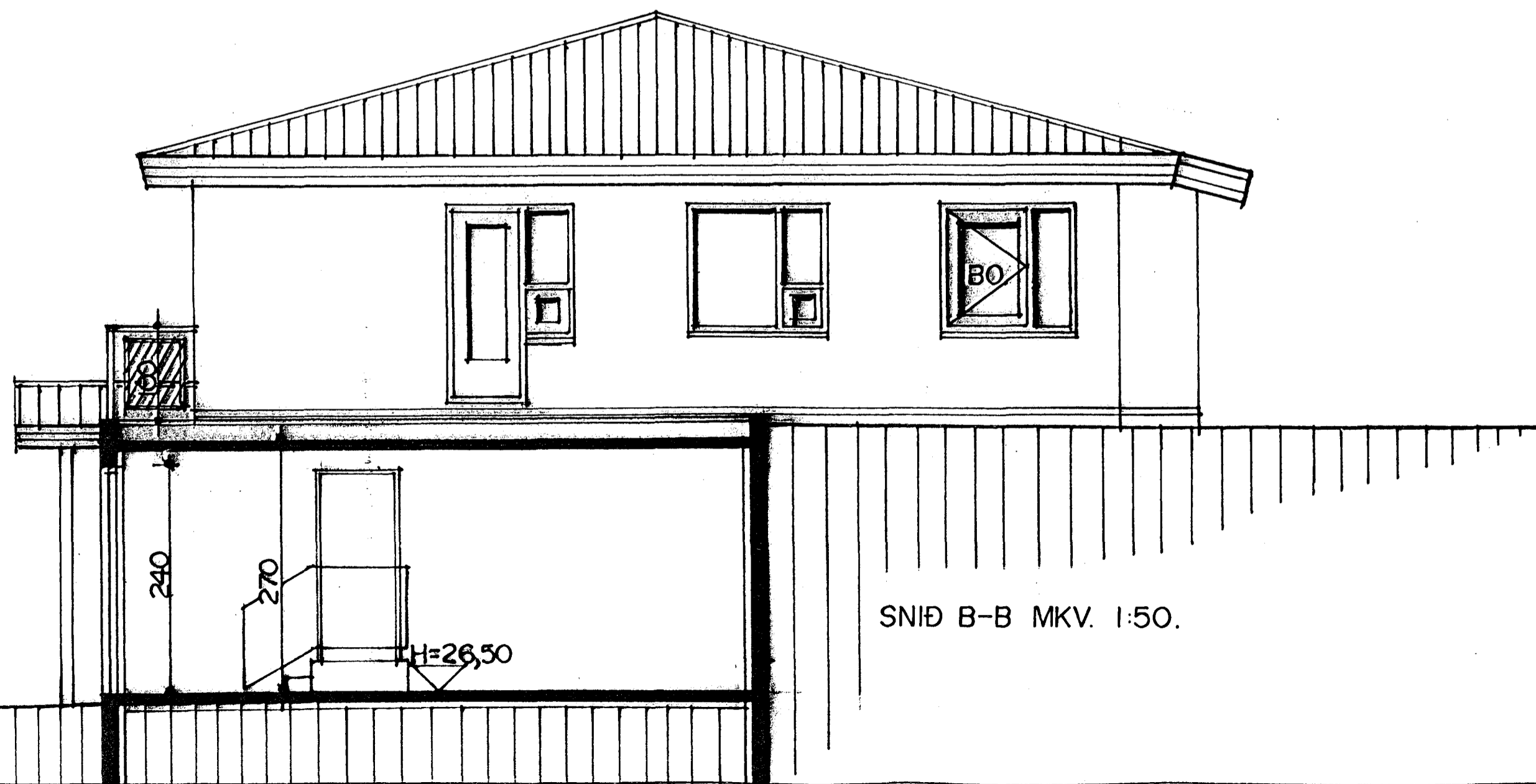
SNÍÐ B-B MKV. 1:50.