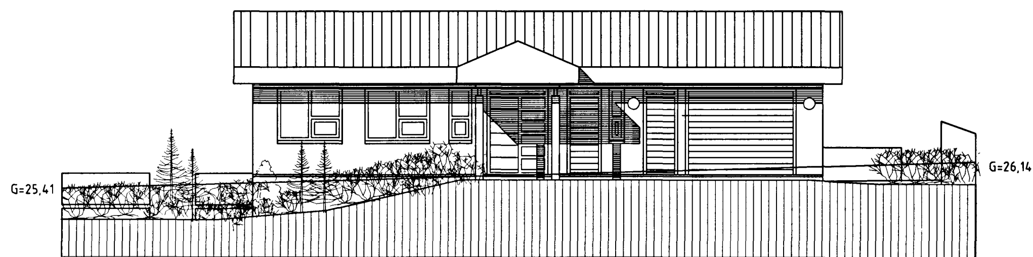
Útlit austur. mkv. 1:100.