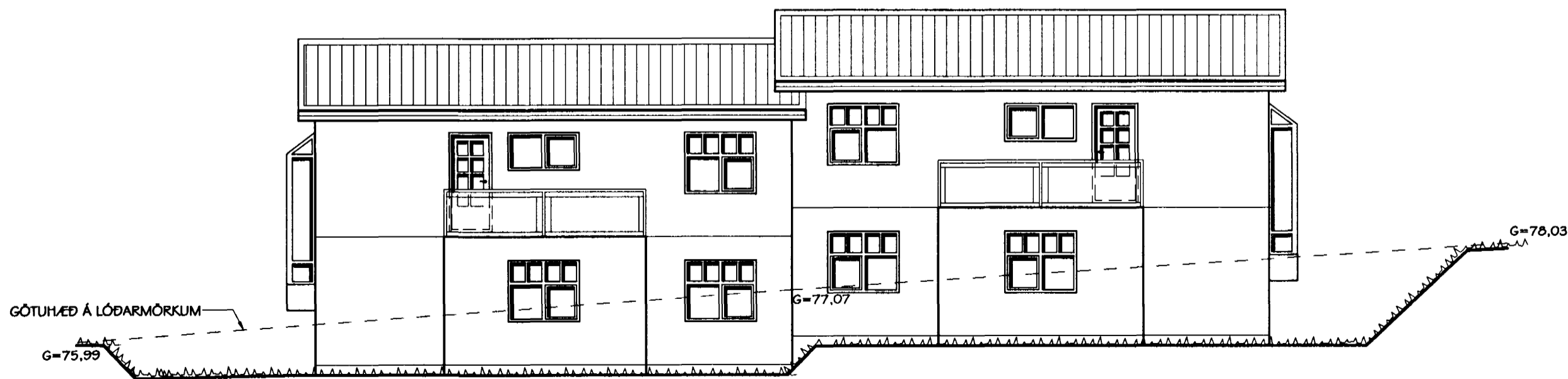
ÚTLIT VESTUR HLIÐAR MKV. 1:100