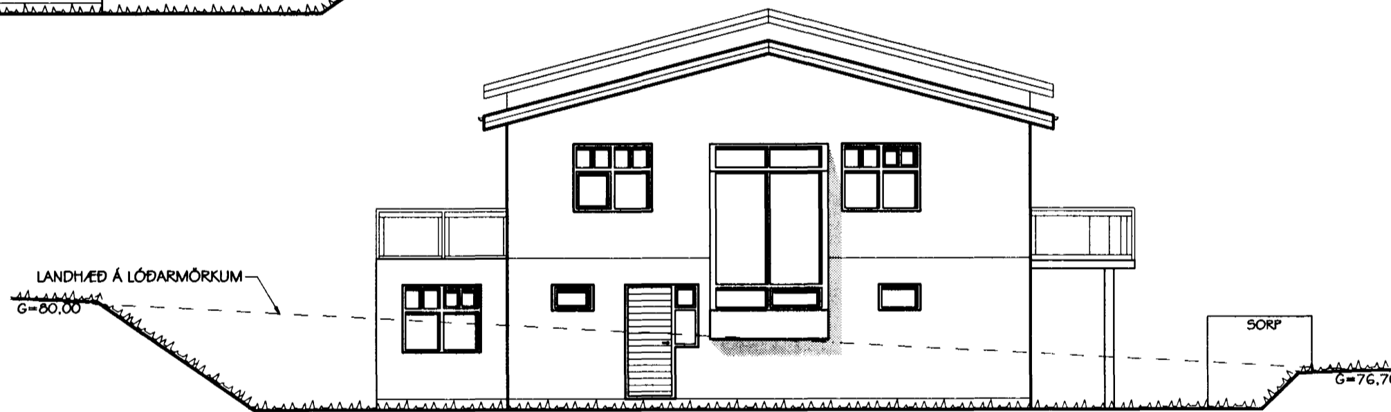
ÚTLIT SUÐLÆG HLIÐ MKV. 1:100