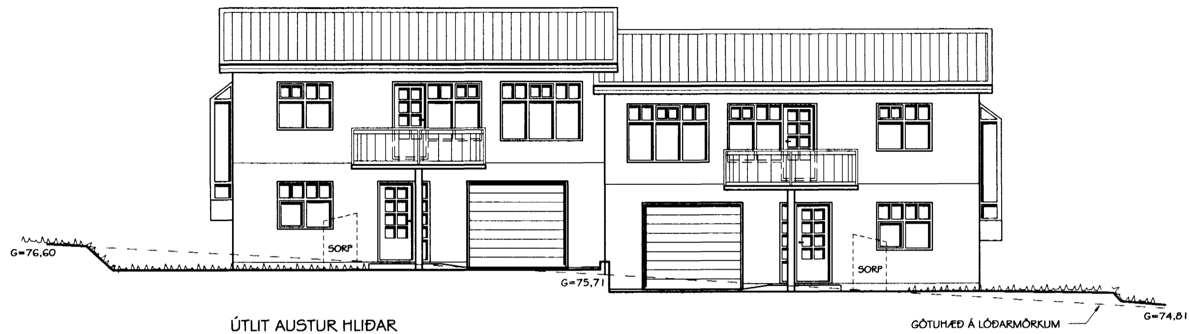
ÚTLIT AUSTUR HLIÐAR MKV. 1:100

Samþykkt þann 18 JULI 2001 Byggingafulltrúinn í Hafnarfirði F.h. Sigurbjartur Halldórsson