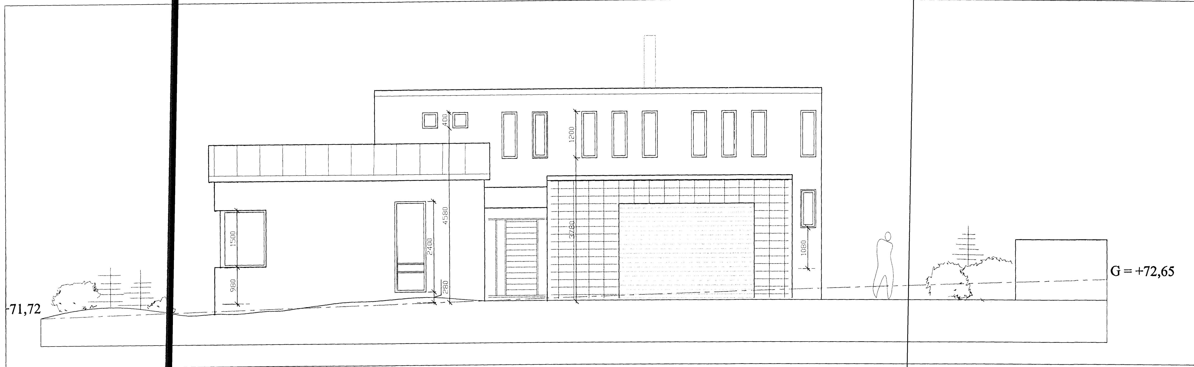
útlit til suður, 1:50