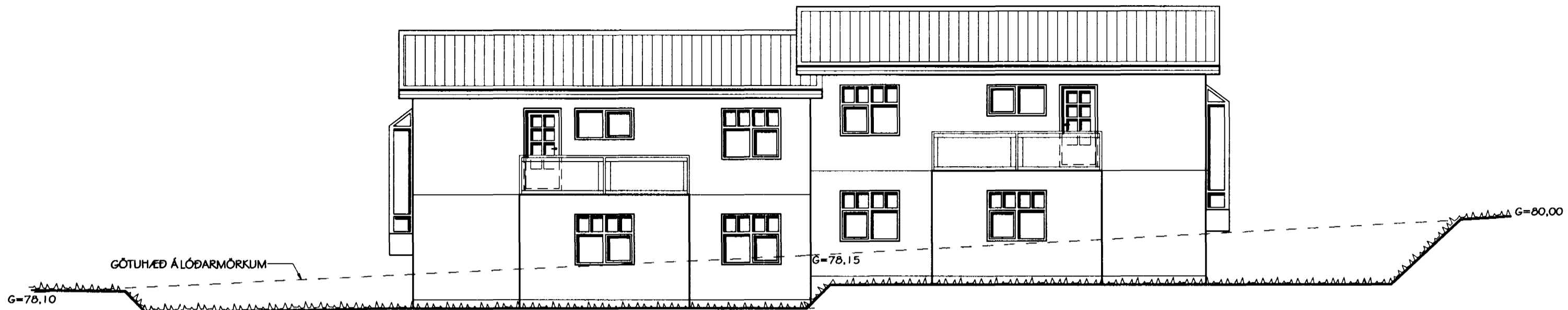
ÚTLIT SUÐ-VESTUR HLIÐAR MKV. 1:100

Samþykkt þann 17 JULI 2001 Byggingafulltrúinn í Hafnarfirði F.h. Sigurbjartur Hallgrímsson