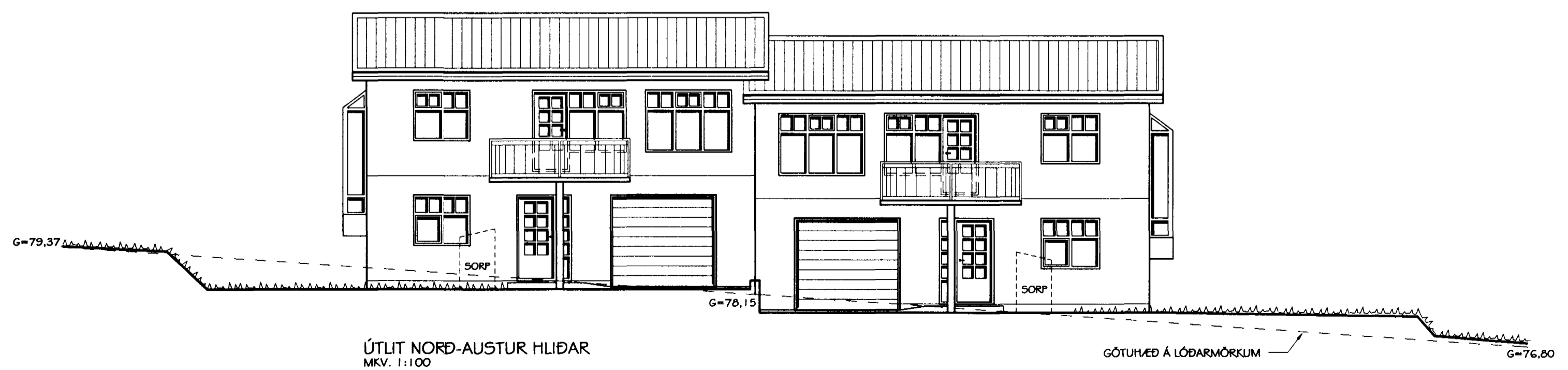
ÚTLIT NORÐ-AUSTUR HLIÐAR MKV. 1:100