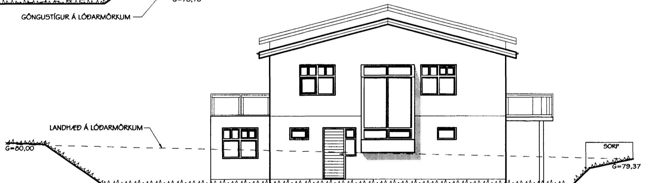
ÚTLIT SUÐ-AUSTUR HLIÐ MKV. 1:100