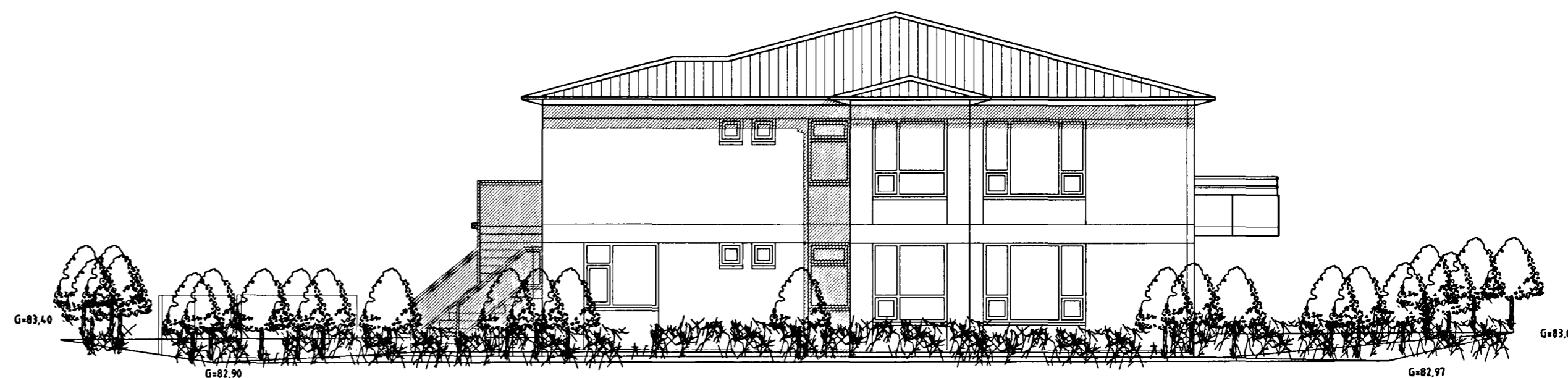
ÚTLIT VESTUR MKV. 1:100.