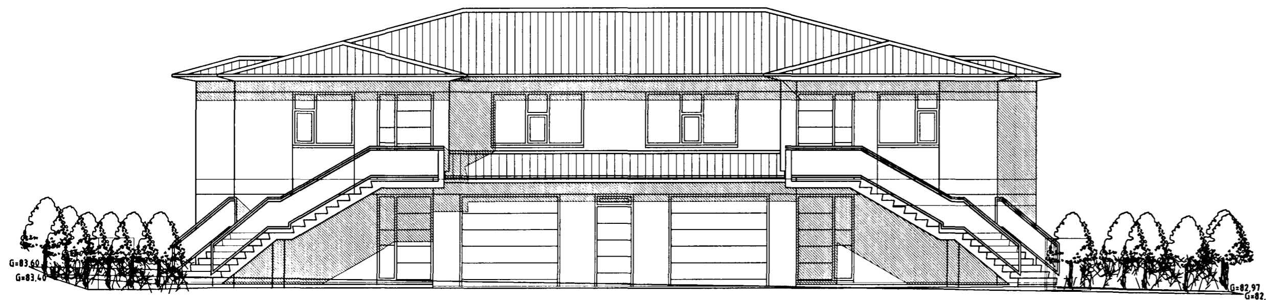
ÚTLIT NORÐUR MKV. 1:100.