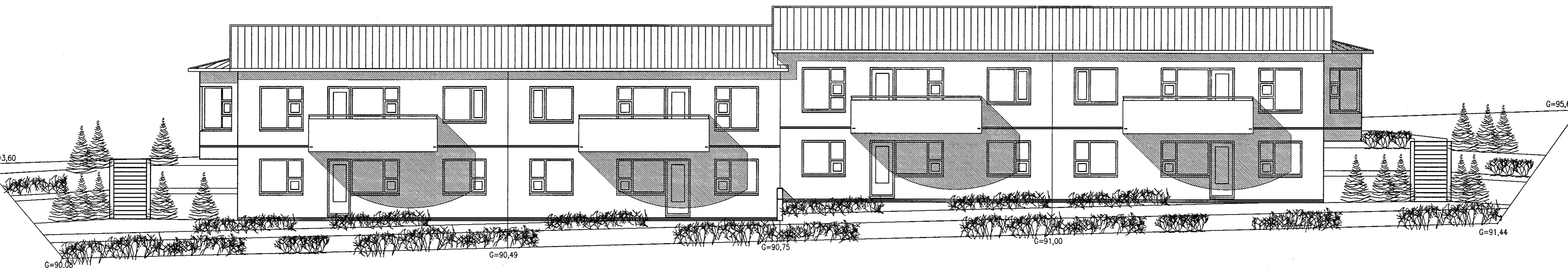
ÚTLIT VESTUR MKV. 1:100.

tifftopdf - www.rubissoftware.com - Demo Version