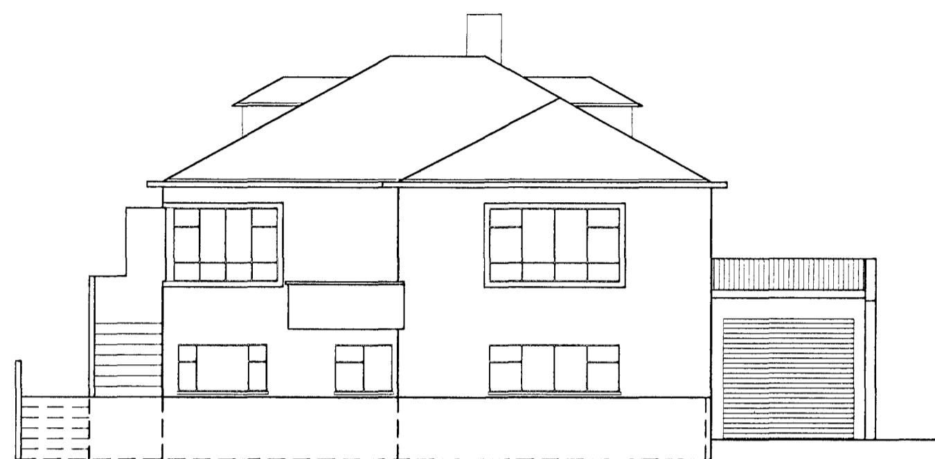
Ásýnd suður (að götu)