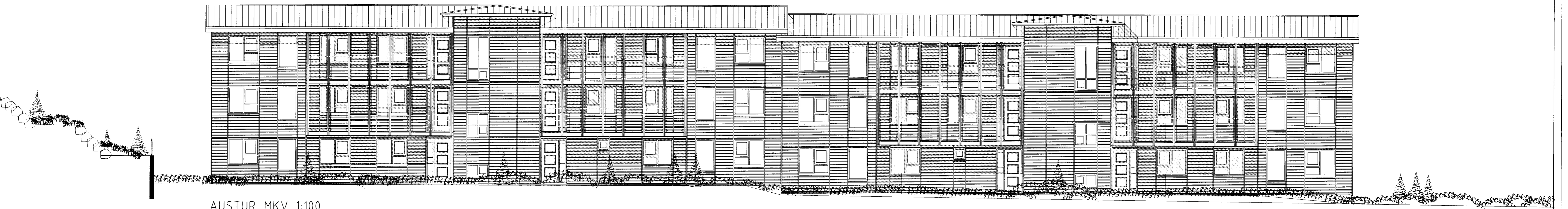
AUSTUR MKV. 1:100.