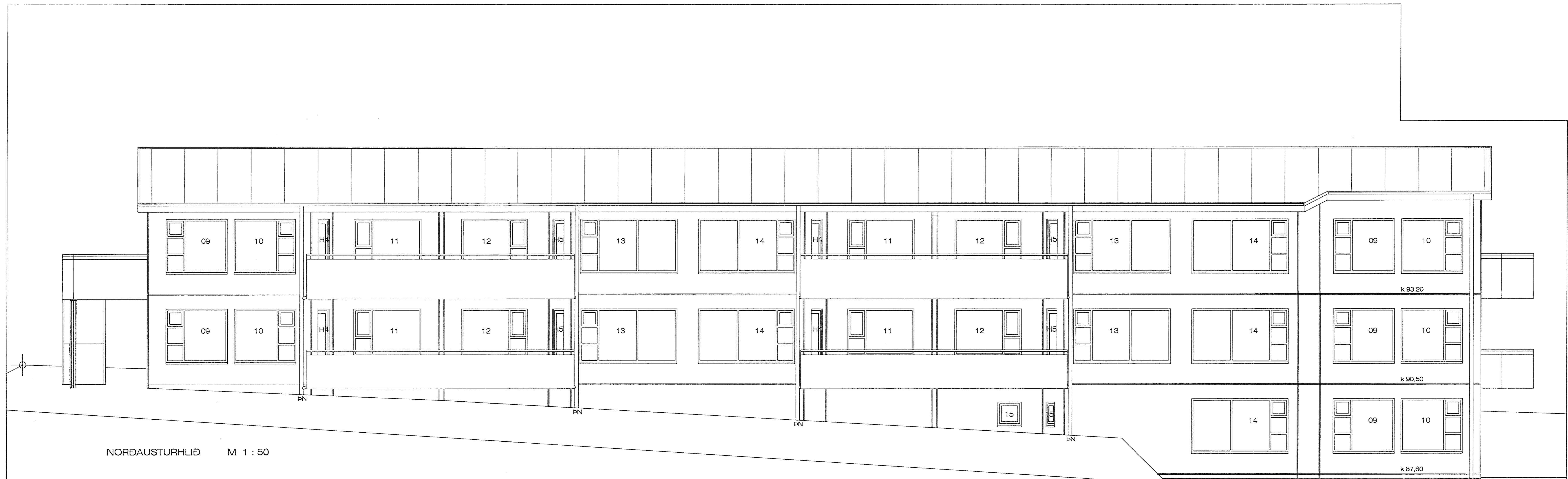
NORÐAUSTURHLIÐ M 1 : 50