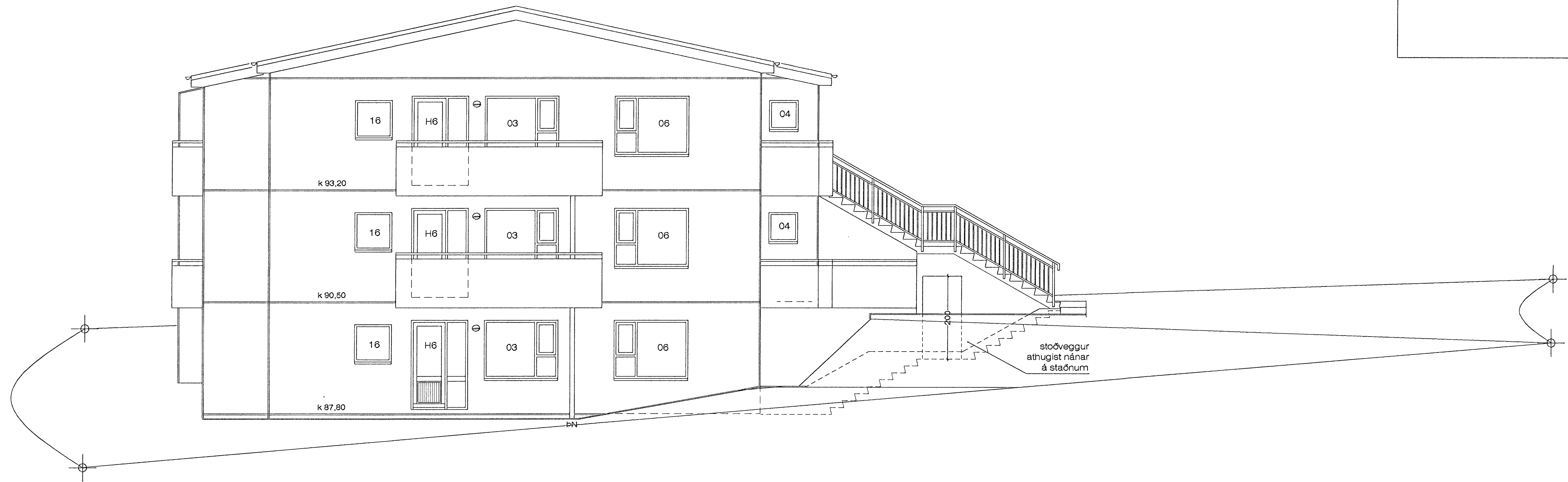
NORÐVESTURHLIÐ M 1 : 50