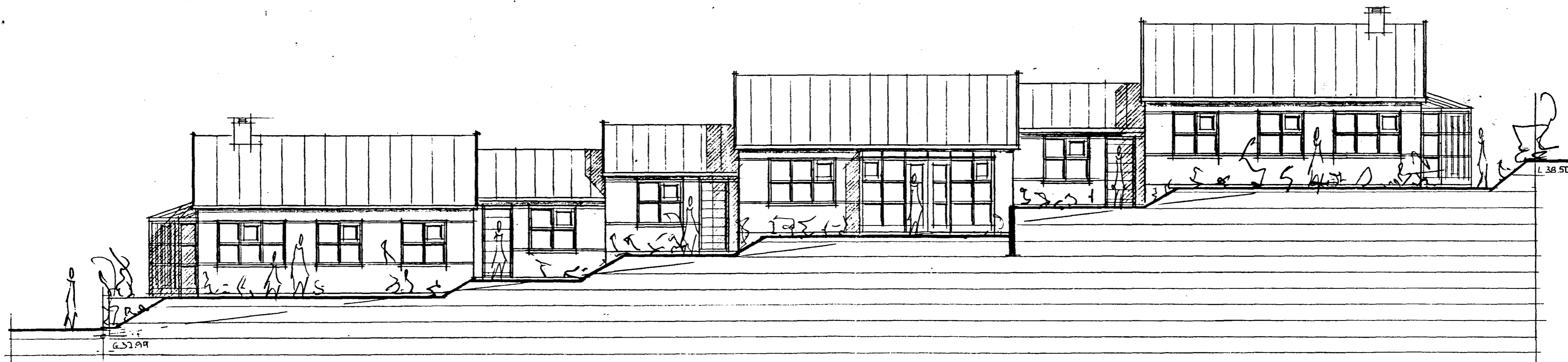
ÚTLÍÐ NORÐ-VESTUR M=1:100

tifftopdf - www.rubissoftware.com - Demo Version