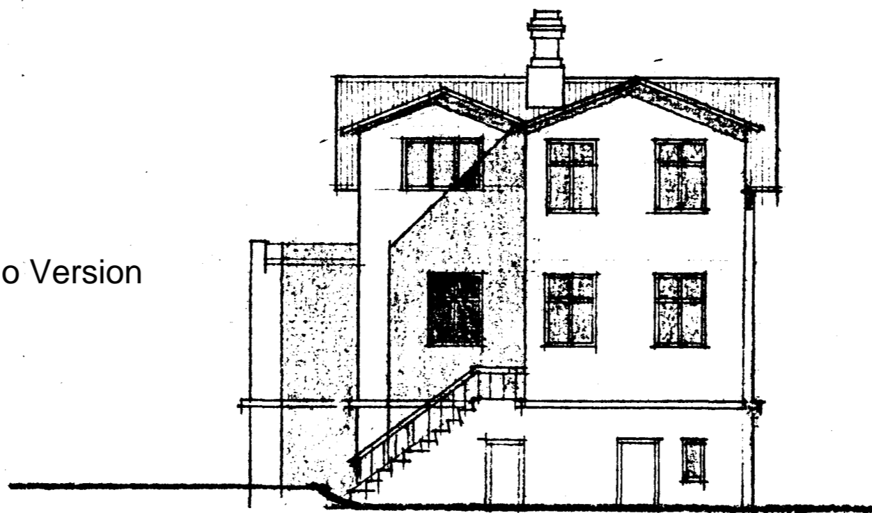
VESTURHLIÐ M. 1:100