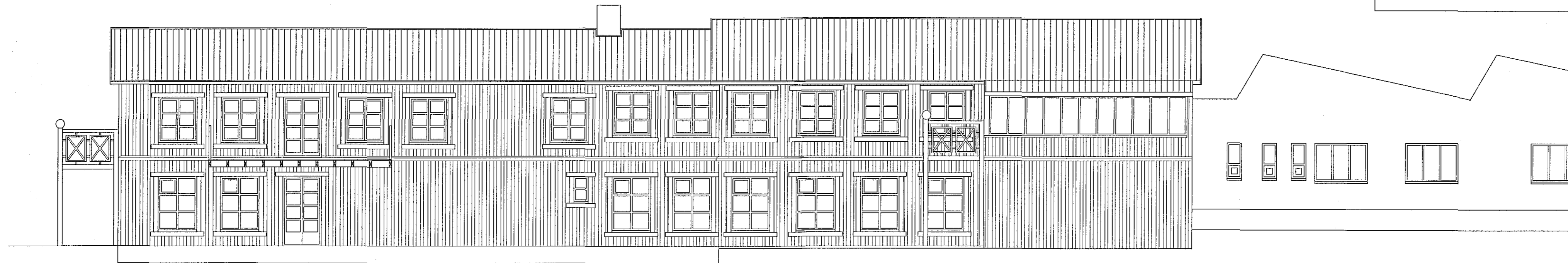
Suður mkv. 1:100