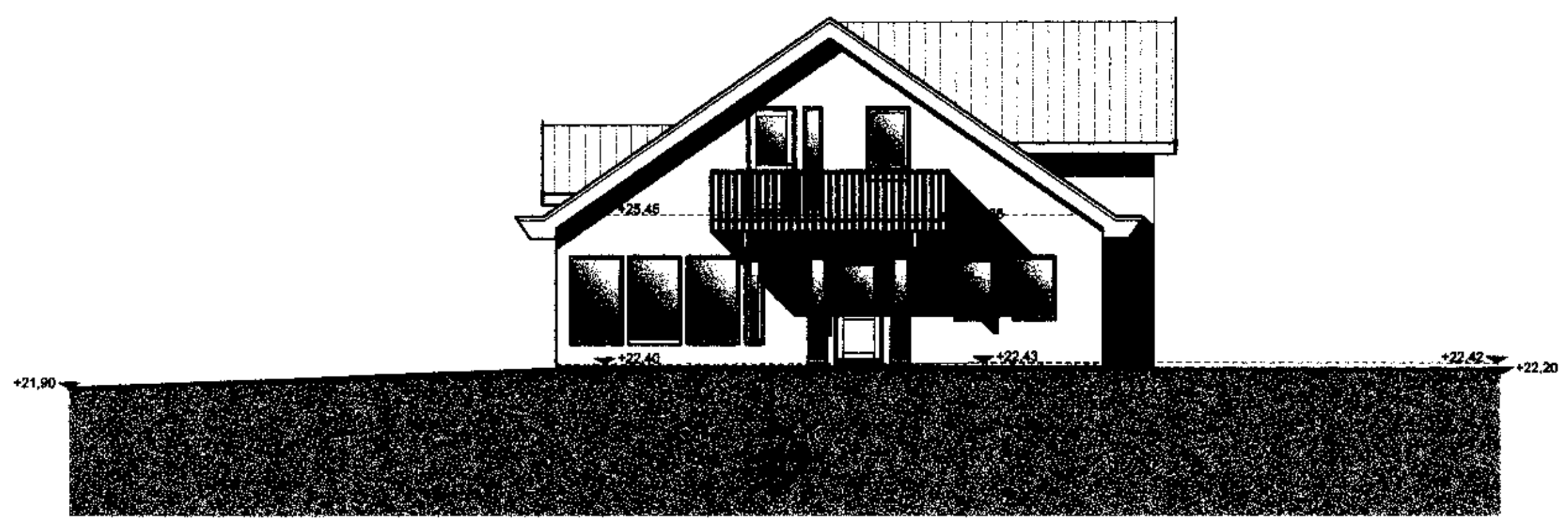
Vestur Útlit 1:100

Byggingafrúnn í Hafnarfirði F.h. Jón Sigurðsson