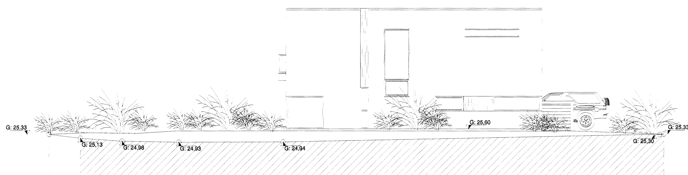
Útlit til norðurs