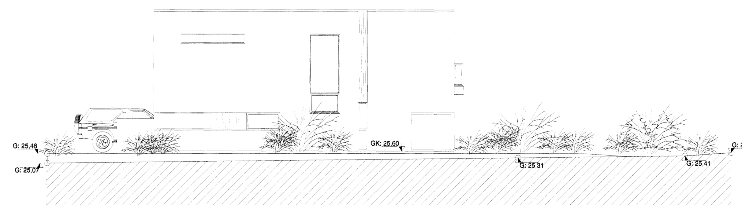
Útlit til suðurs

VEKTOR - hönnun og ráðgjöf - Akralind 8, 201 Kópavogi.