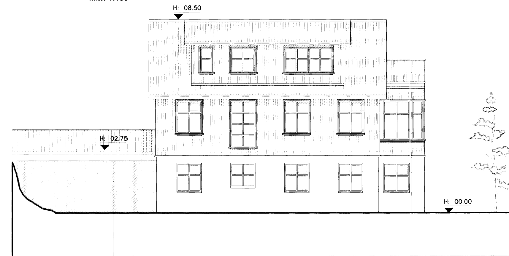
Ásýnd Norð-vestur mkv. 1:100