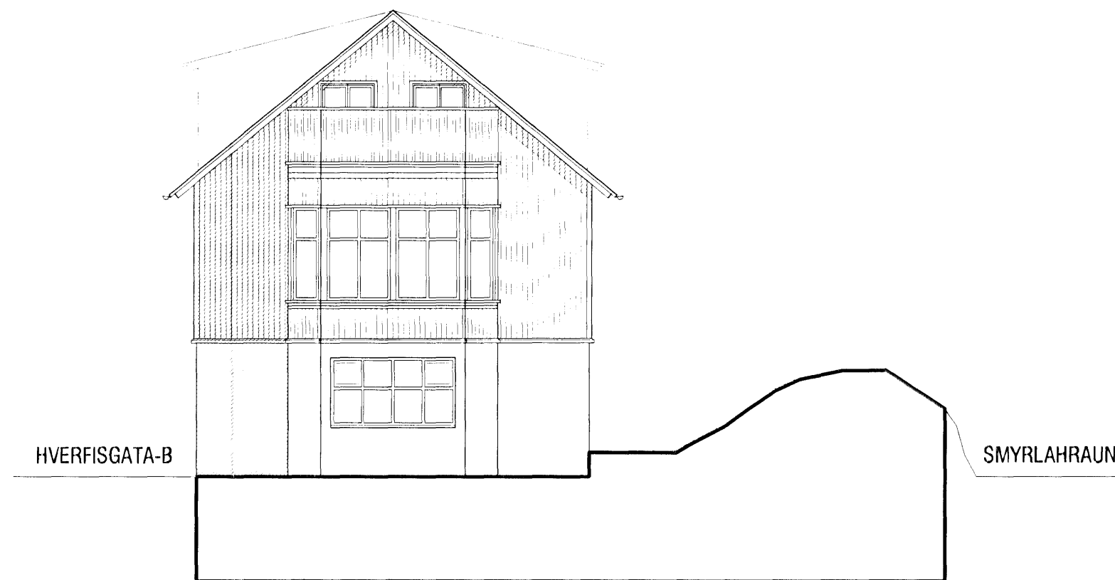
Ásýnd Suð-Vestur mkv. 1:100