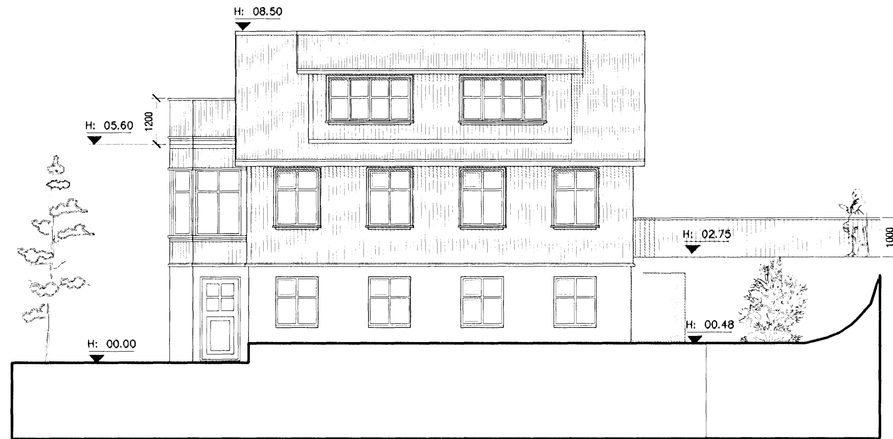
Ásýnd Suð-Austur mkv. 1:100