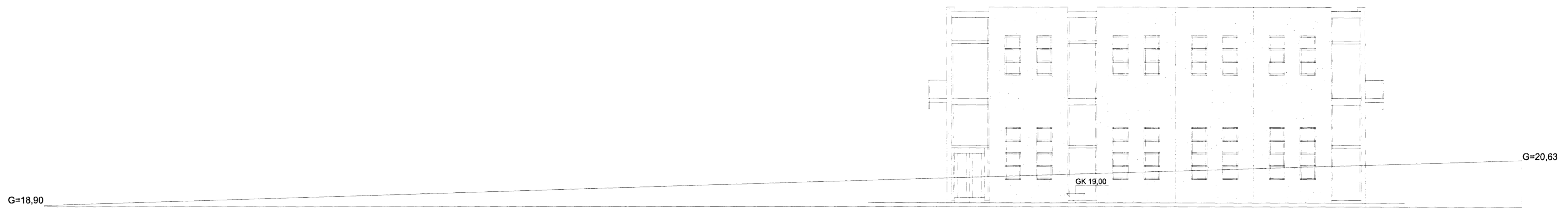
SUÐURHLIÐ MKV. 1:100

Byggingarfulltrúi samþykkir erindi. 15.11.2006 Þessi skýrsla er samþykkt þessu dögum og tekur tillit til þess að byggingarfulltrúi er bundin af ákvarðanirum byggingarfulltrúis og er ekki ábyrgð fyrir kostnaði byggingarfulltrúis. Hafnarfjörður, 15.11.2006 Rún Kustur Þ. Hannesson