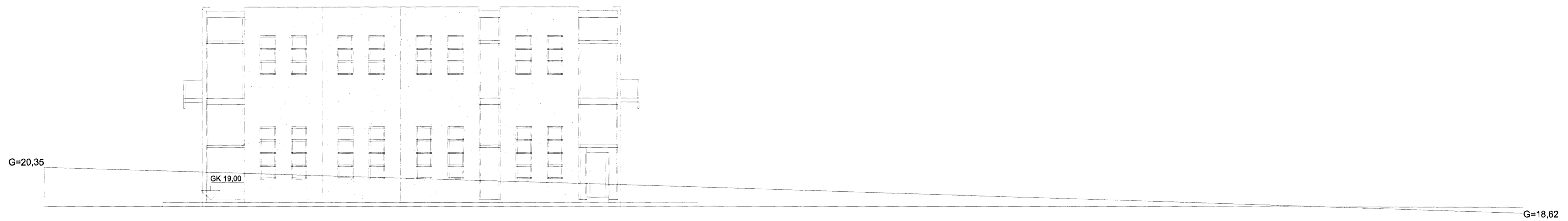
NORÐURHLIÐ MKV. 1:100