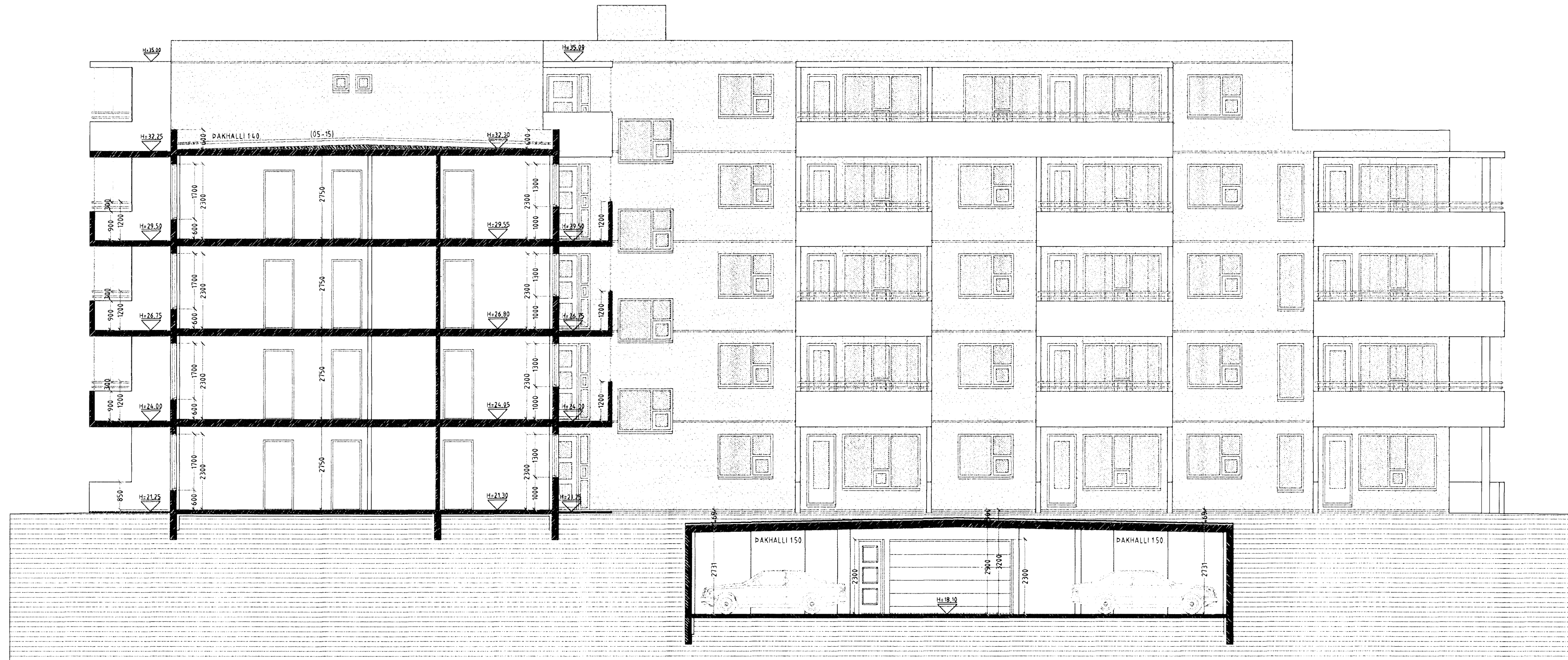
SNID A-A MKV. 1:100.