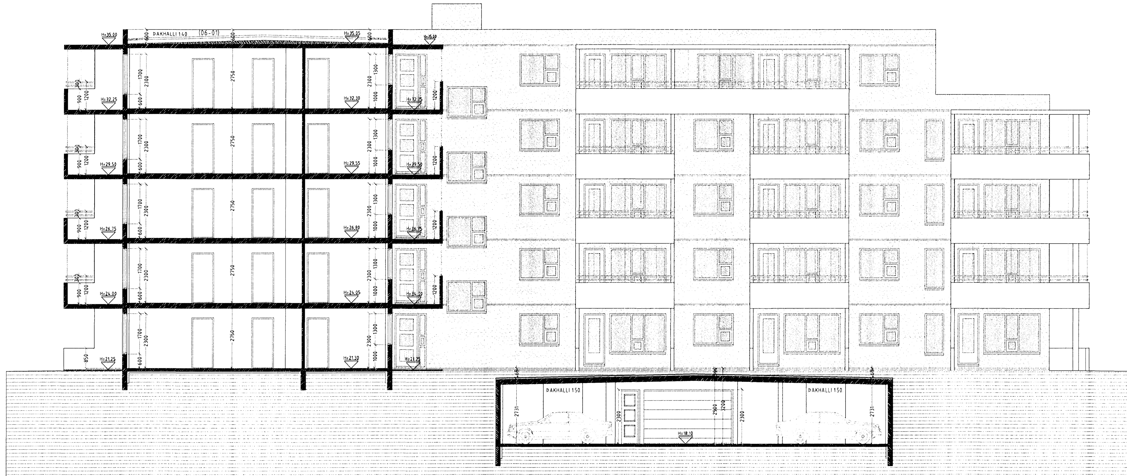
SNID B-B MKV. 1:100.

Til skjólmyndunnar á svalgöngum er svalagöngum lokað að hluta með 8 mm hertu gleri. Til að uppfylla ákvæði bygginga og brunareglugerða varðandi reykkræstingu má glerklæðning/ lokun ekki loka svalagöngi meira en að tryggð verði eðlileg reykkræsting svalagönganna. Það er gert þannig í þessu tilvik að reyst er stálvirki sem ber uppi glerklæðningu úr 8 mm hertu gleri. Gler stöðir eru þannig að 100 mm rífa myndast neðan við gler á milli glerplöngna sítt hvorumegin við stálsúlur er 100 mm rífa, og að ofan er 500 mm bil. Á þann hátt er tryggð 40% opnun flatarins.