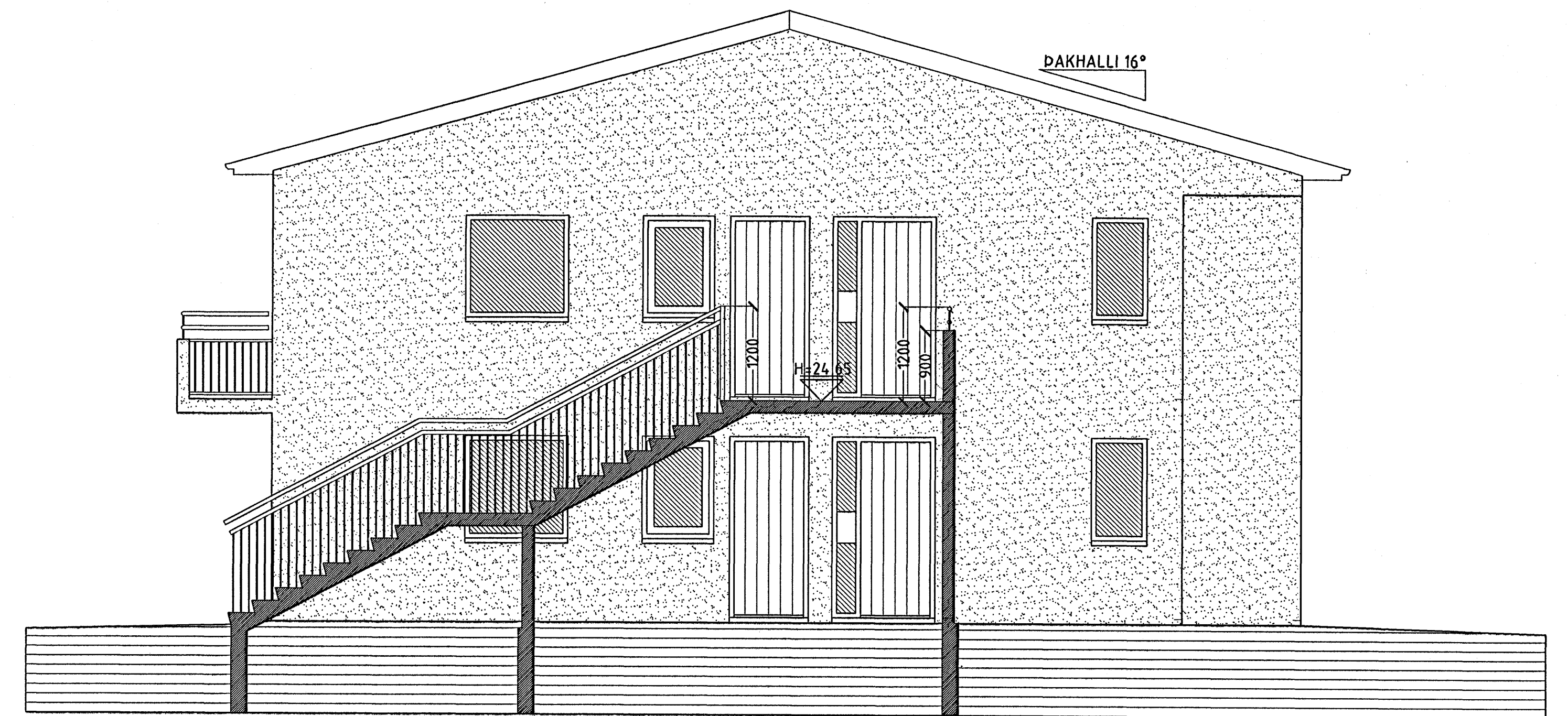
SNID C-C MKV. 1:50.