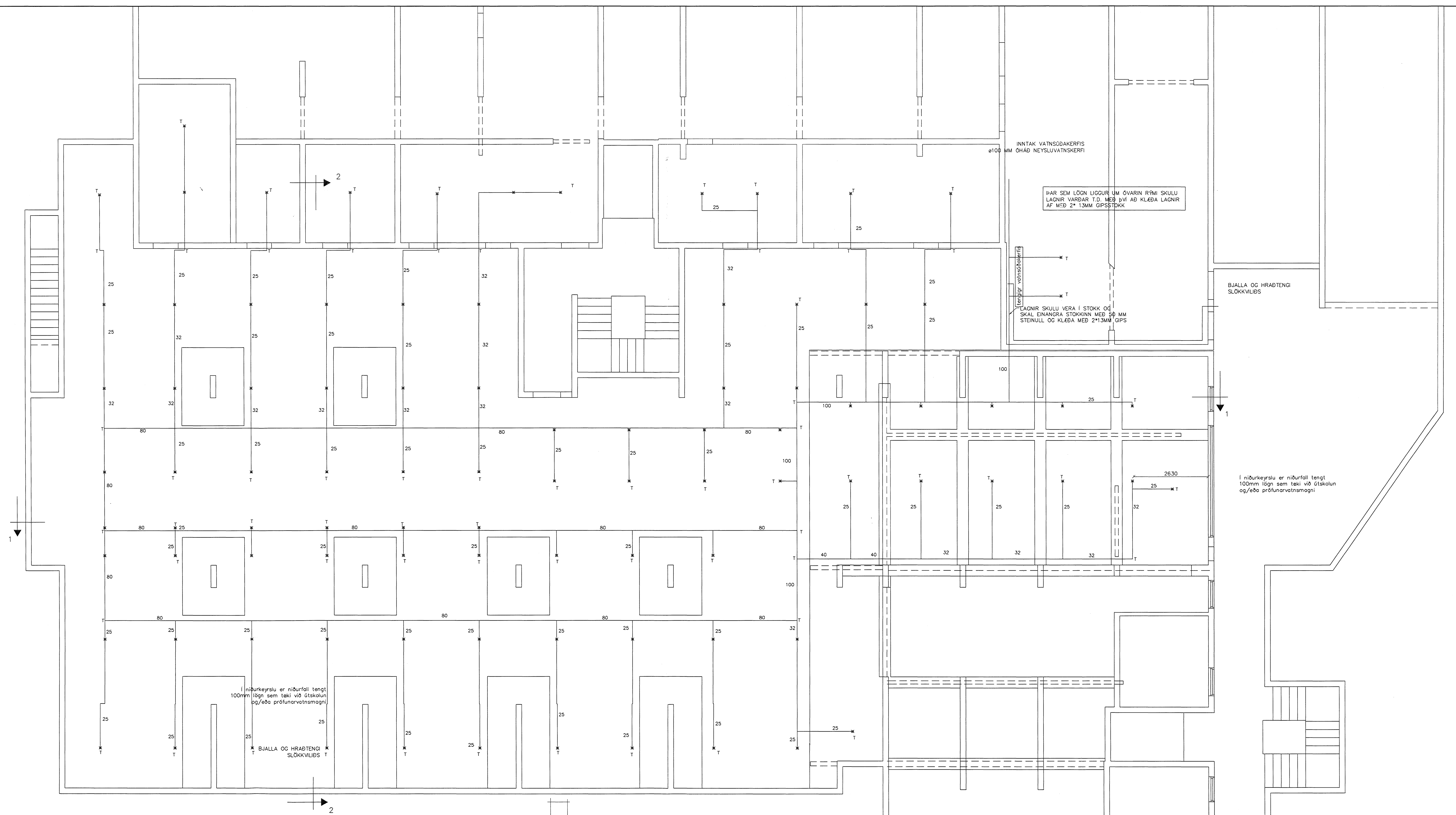
GRUNNMÝND KJALLARA 1:50