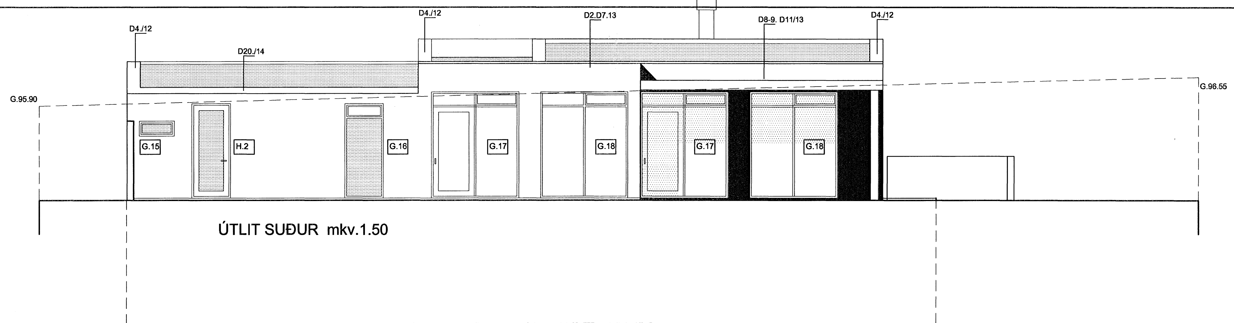
ÚTLIT SUÐUR mkv.1.50