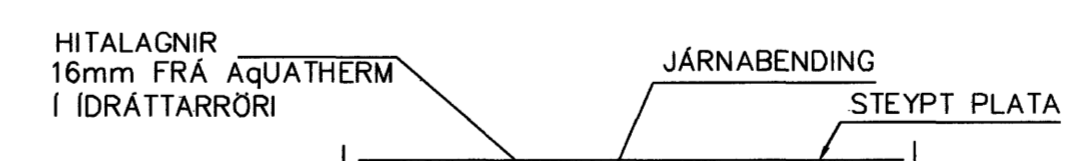
LAGNIR, SNID, 1:20