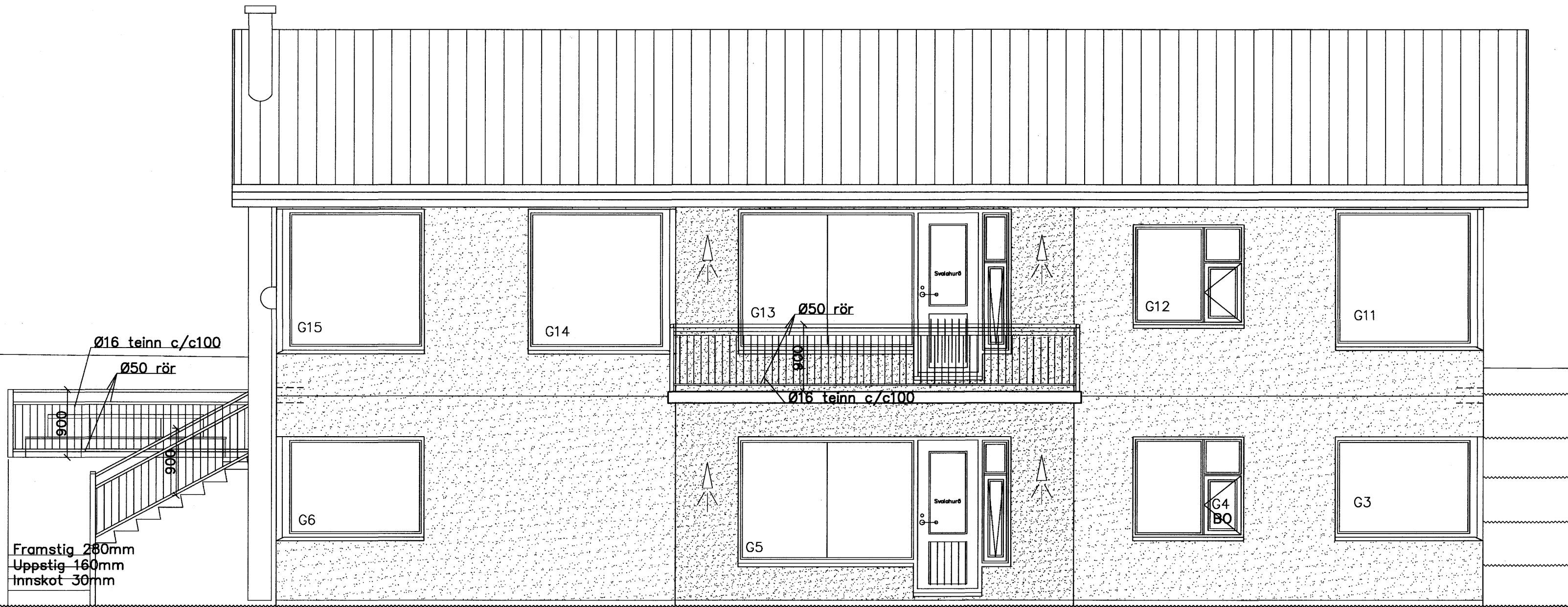
ÚTLIT AUSTUR 1:50