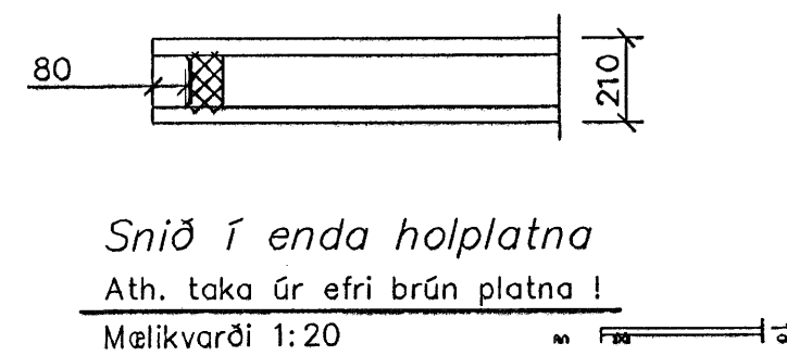
Snið í enda holplatna Ath. taka úr efri brún platna! Málkvörði 1:20