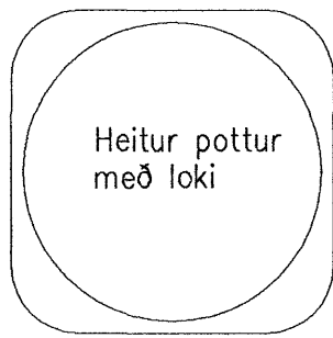
Heitur pottur með loki

Nákvæm staðsetning á niðurföllum utanhúss í samræði við lóðarhönnuð. Marka skal í hellulögnum staðsetningu brunna. (Staðsetning brunna undir hellulögnum)