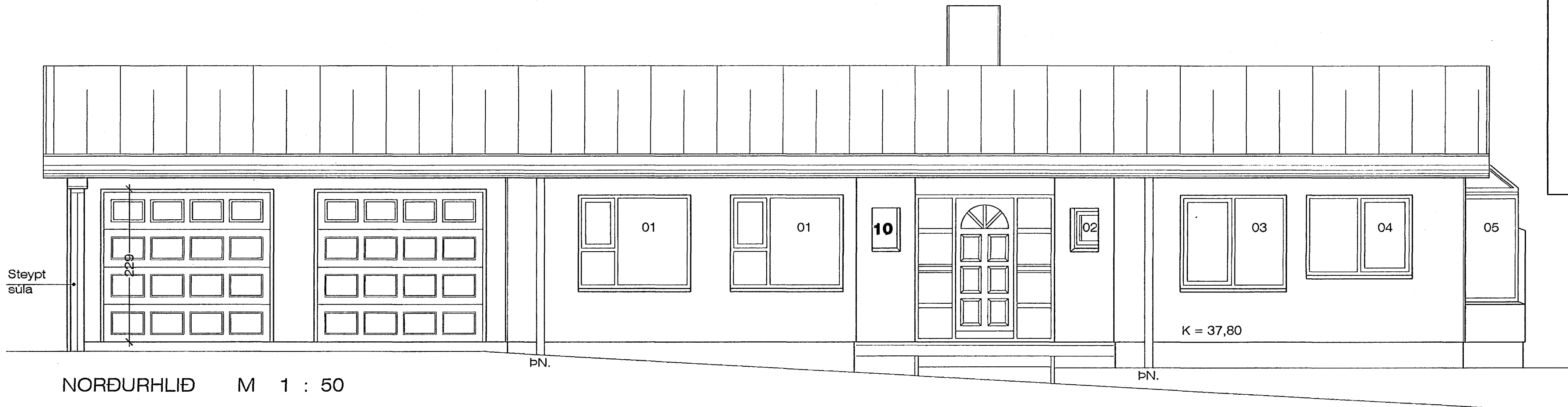
NORÐURHLIÐ M 1 : 50