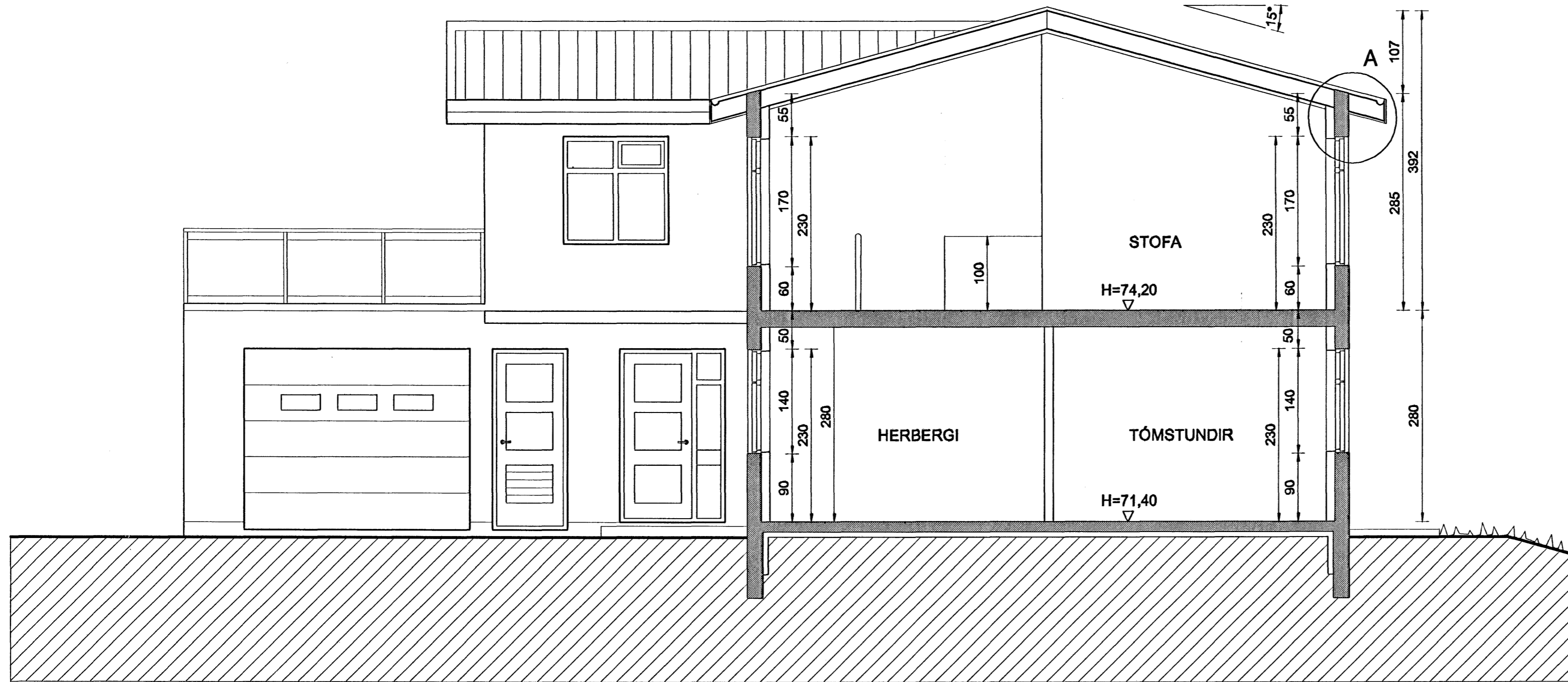
SNID A-A MKV. 1:50